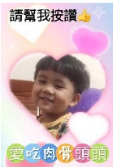
幼兒:范 O 硯 我會唱兒歌~一隻哈巴