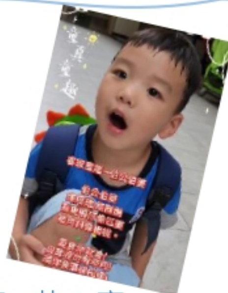
幼兒:范 O 齊 我會唱客家童謠~伯公伯婆