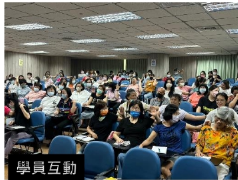
課堂小遊戲:透過兒歌依比呀呀, 左右手比出相反的手勢, 考驗反應專注力