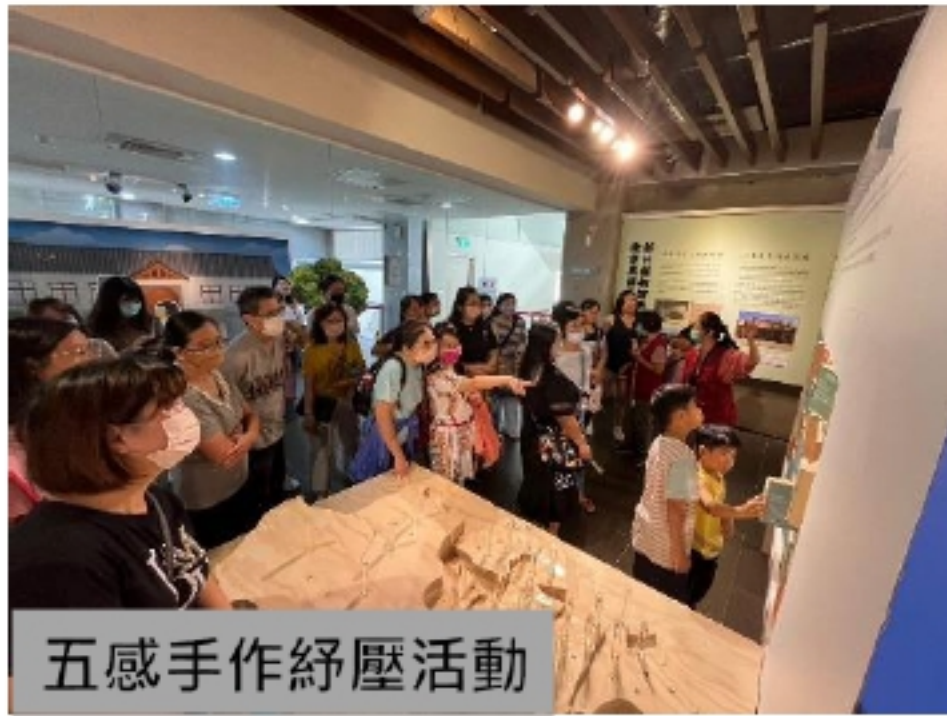
五感手作紓壓活動