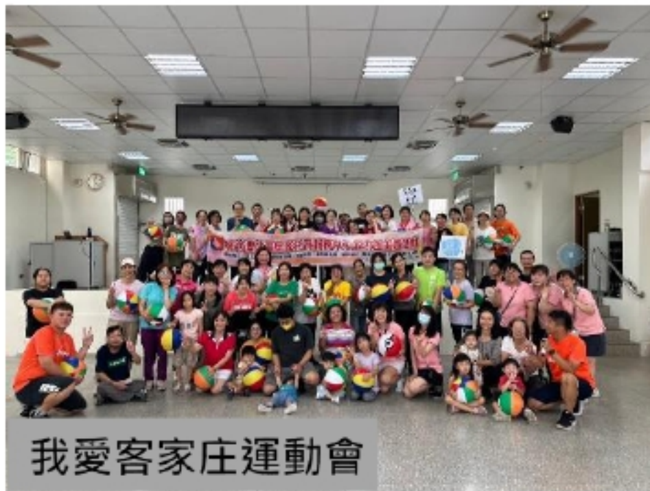
我愛客家庄運動會