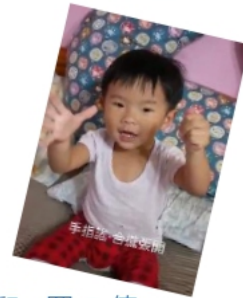
幼兒:羅 O 倚 手指謠~合攏張