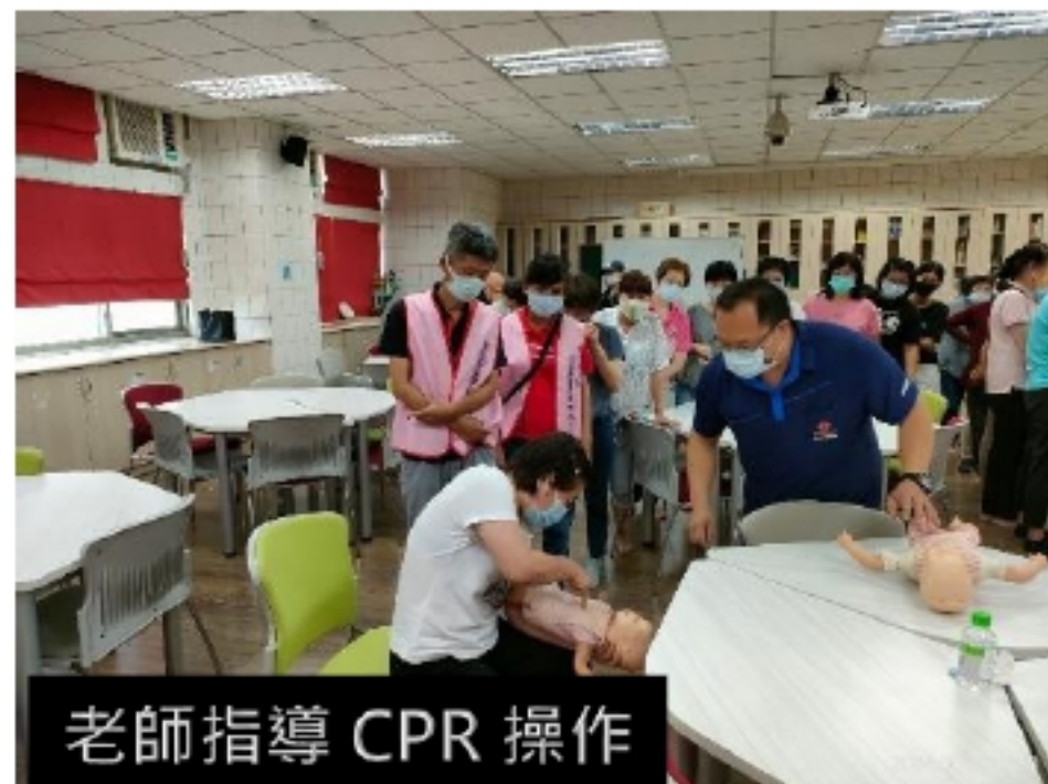
老師指導 CPR 操作

成 為一個有技巧的專業托育人員，工作認同感是托育服務工作入門的門票，而持續的訓練能改善與增加工作技巧，更是托育夥伴不斷進步的課題。在職訓練能促進夥伴們取得可運用的知識，也能提升對其能力技巧的自信，成為一位更好的工作者。