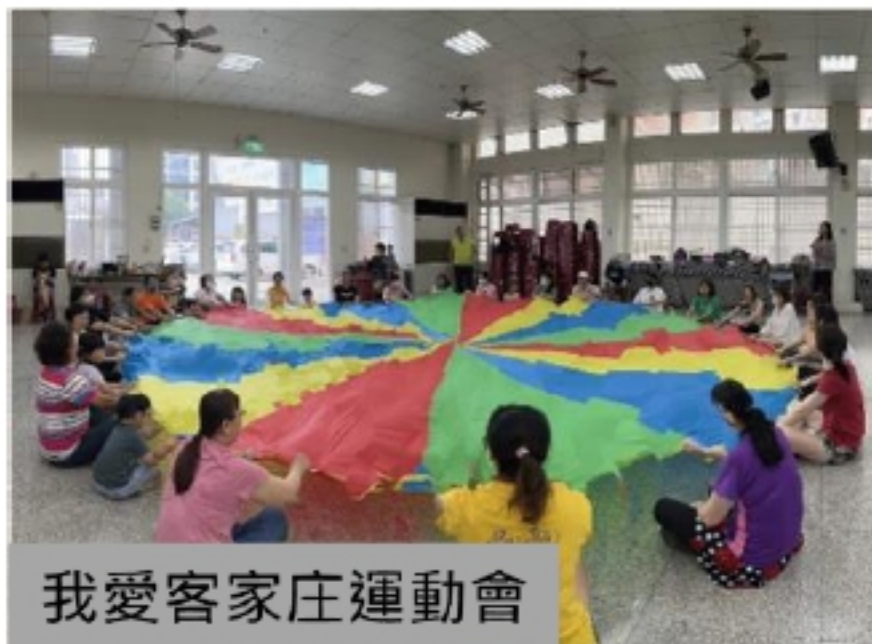
我愛客家庄運動會