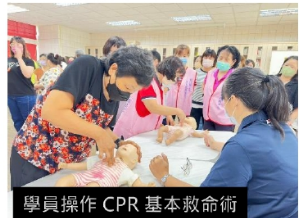
學員操作 CPR 基本救命術