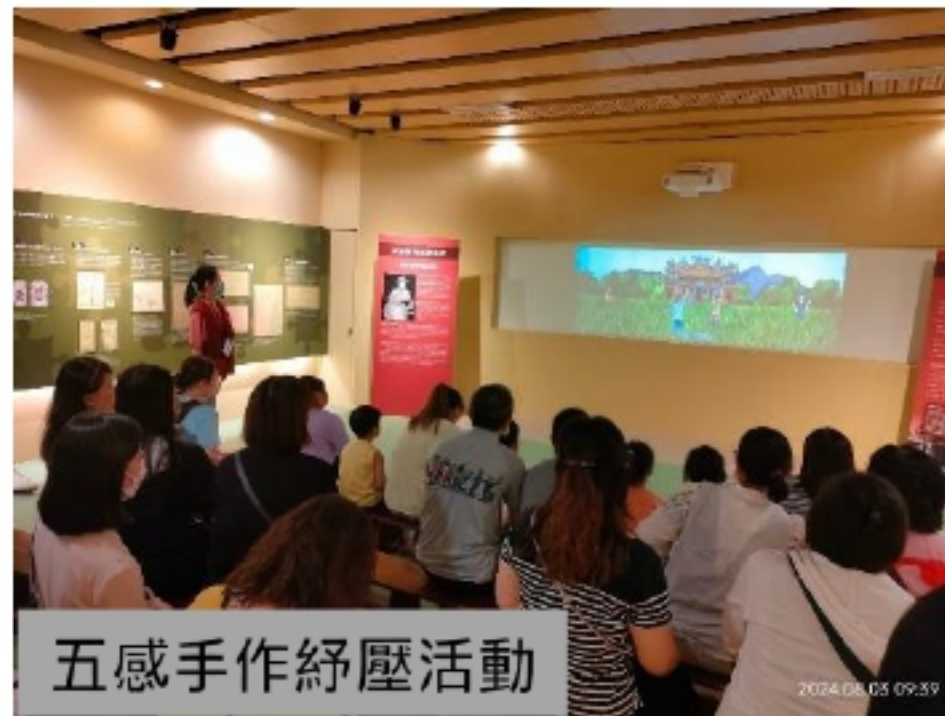
五感手作紓壓活動