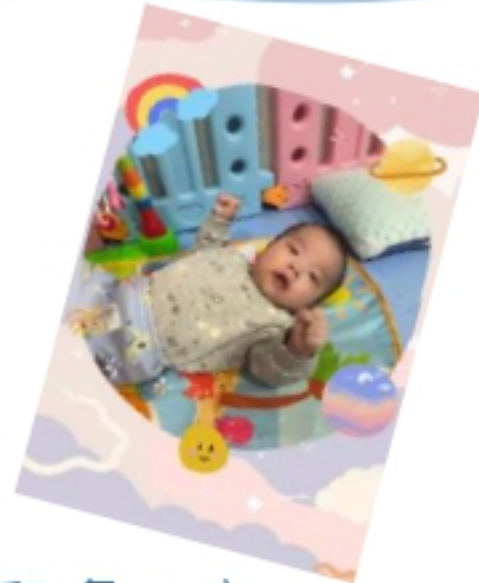
幼兒:詹 O 安 安安愛說話