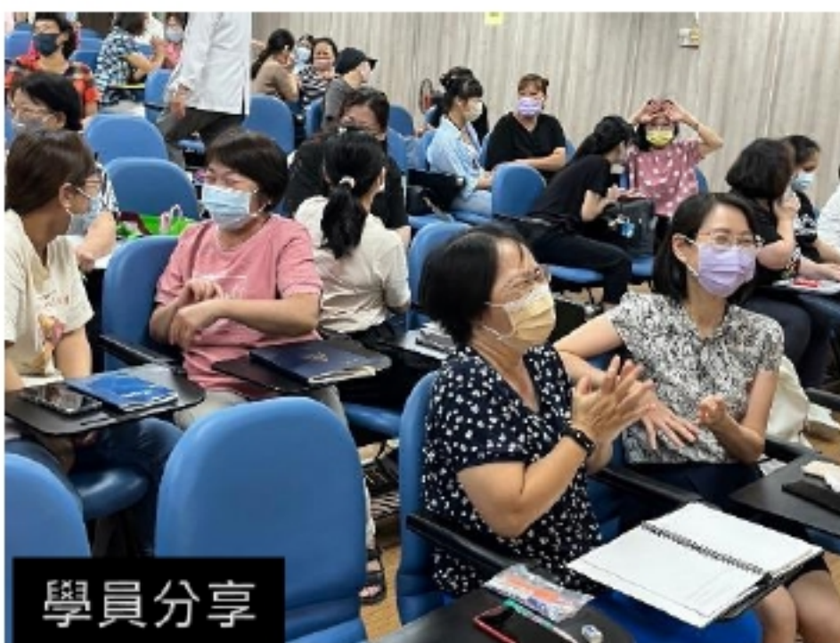
夥伴們相互分享托育上的經驗