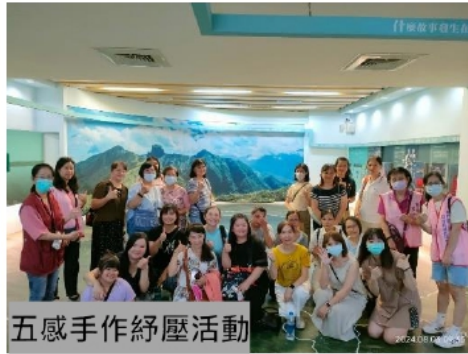
五感手作紓壓活動