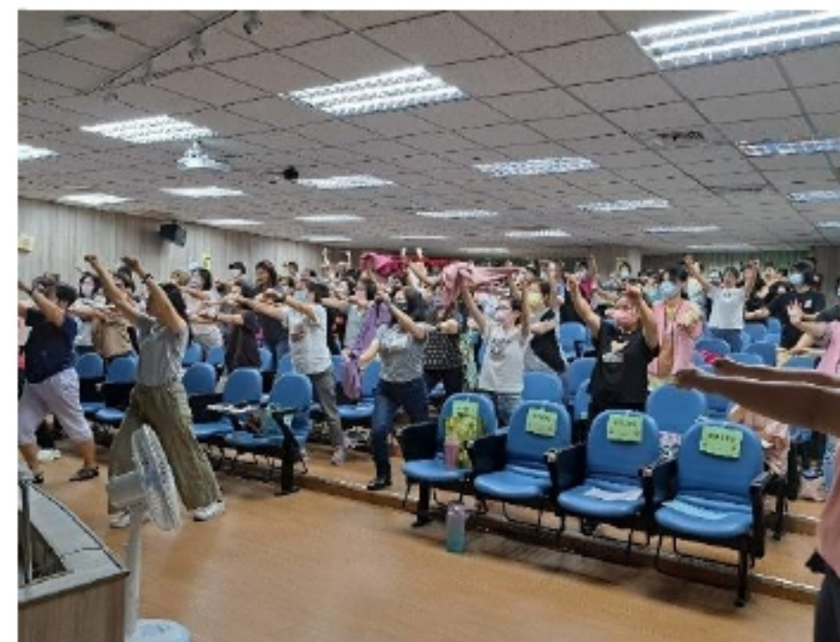
學習透過肢體動作來與對方互動