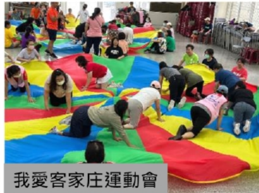
我愛客家庄運動會