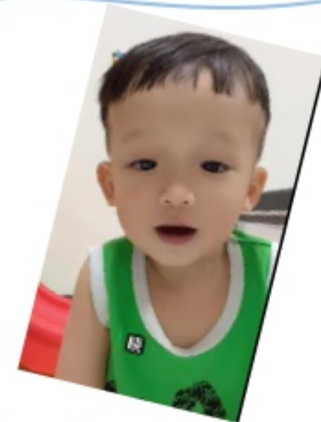
幼兒:嚴 O 山 春曉-春眠不覺"曉"