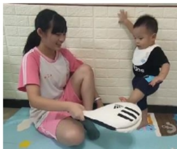
幼兒:彭 O 棠 小小跆拳道高手!薩~