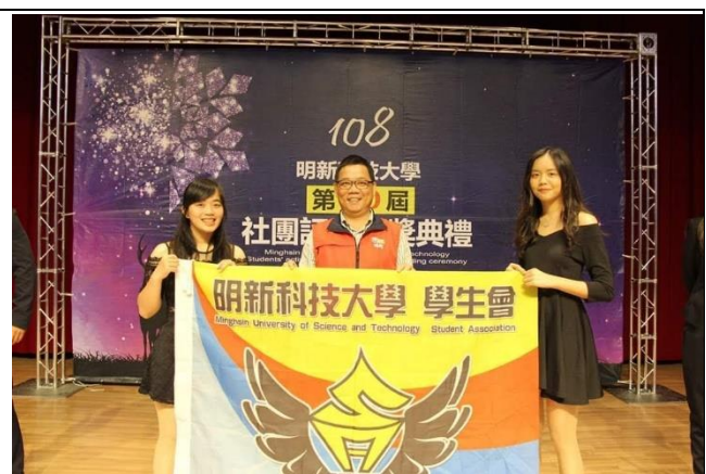
莊同學進行學生會副會長交接