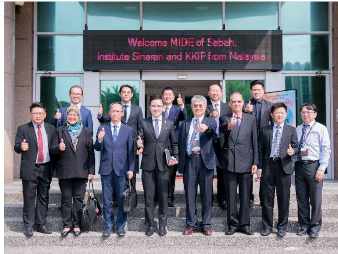
馬來西亞崇正學院、馬來西亞投資發展局、沙巴州工業及企業部、哥打京那巴魯工業區，及沙巴留台同學會等訪問團蒞校參訪。