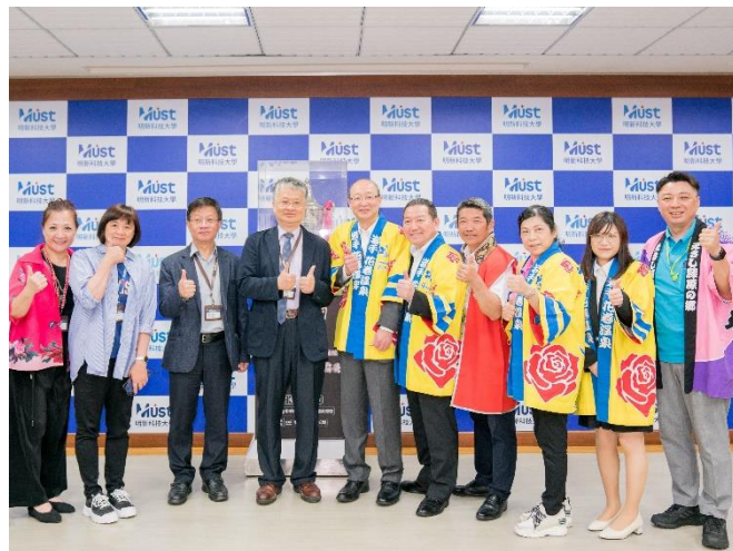
日本花卷溫泉業者訪問團蒞校參訪，洽談產學合作學生實習方案等。