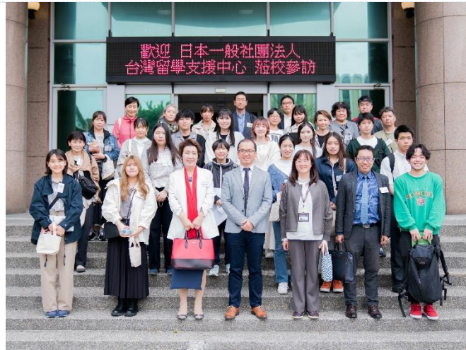
日本一般社團法人台灣留學支援中心訪問團蒞校參訪。