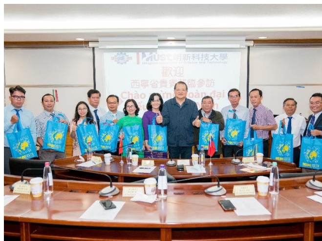
越南西寧省高中校長教育考察團一行蒞校參訪。