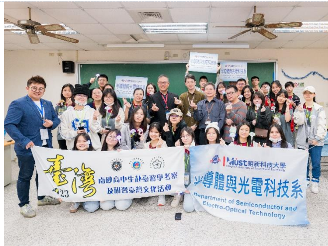
2023 馬來西亞南砂高中生台灣遊學團蒞校參訪。