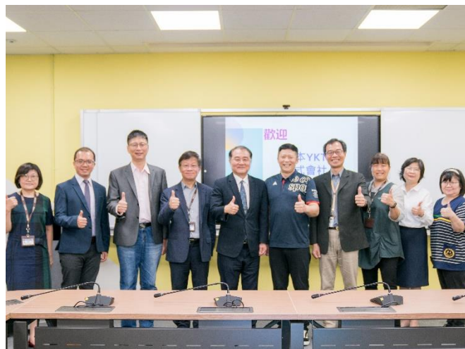
日本 YKT 株式會社訪問團蒞校參訪，洽談學生實習方案。