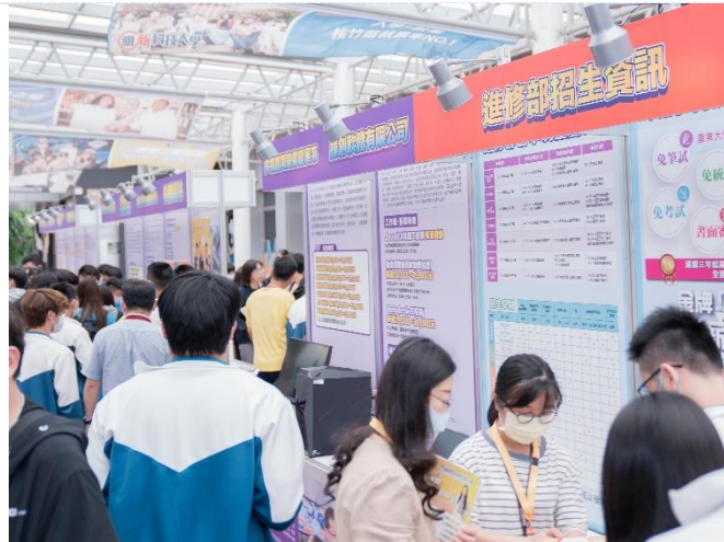
進修部開設「就業導向產學攜手培育班」，舉行「企業訂單式教學嘉年華活動」。