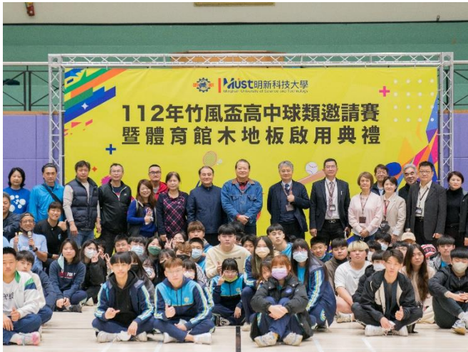
本校獲教育部更新體育館、司令台及大操場養護，體育館地板升級為全國賽事標準場地。體育館更新後，學務處體育室舉行竹風盃高中球類邀請賽啟用。