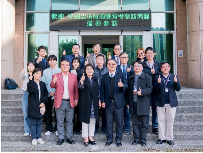
韓國忠清南道教育考察訪問團蒞校參訪。