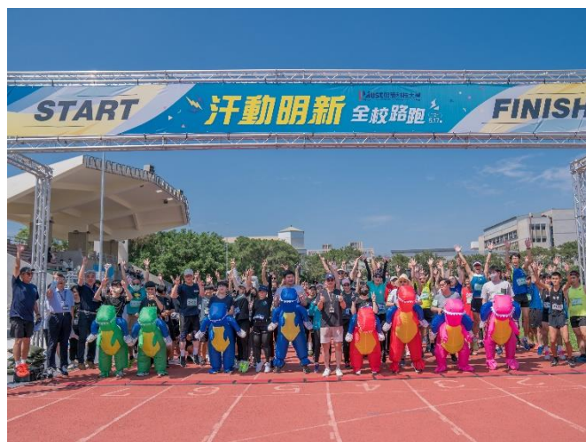
學務處體育室舉辦因疫情停辦 3 年的全校路跑，師生千人齊跑。