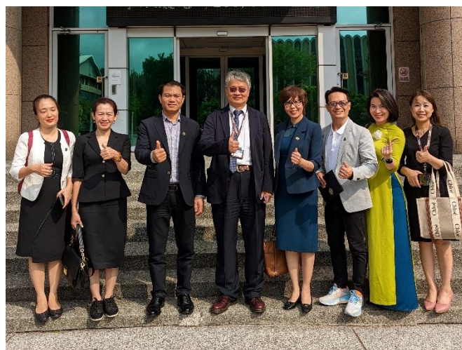
越南河內開放大學訪問團蒞校參訪。