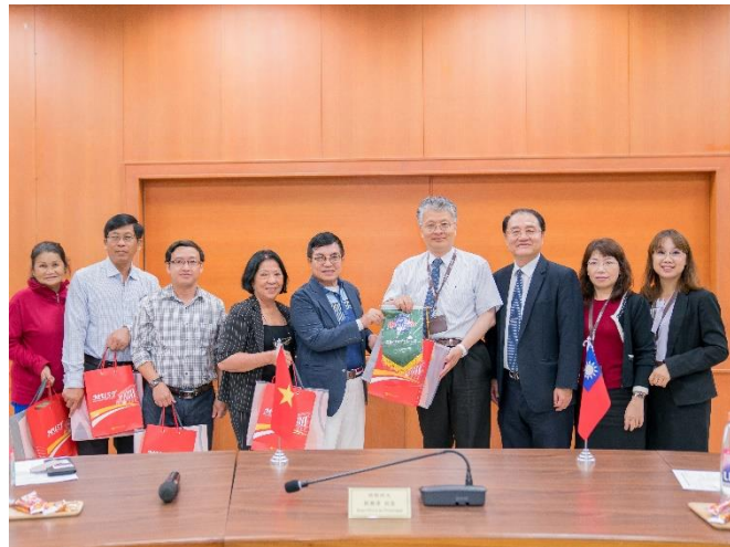
越南西貢高專、明英教育集團貴賓蒞校參訪。