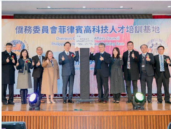
本校與僑務委員會合作成立「菲律賓高科技人才培訓基地」，並行揭牌典禮。