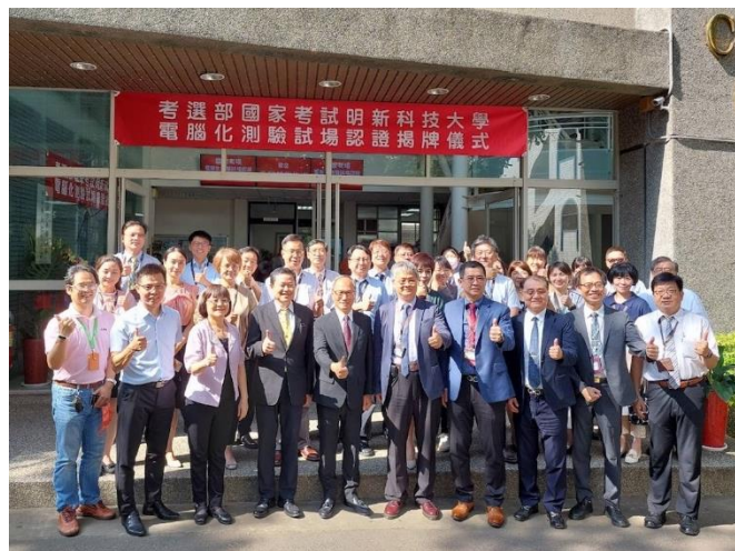
建置「國家考試電腦化測驗試場」並獲得考試院考選部認證通過，舉行揭牌