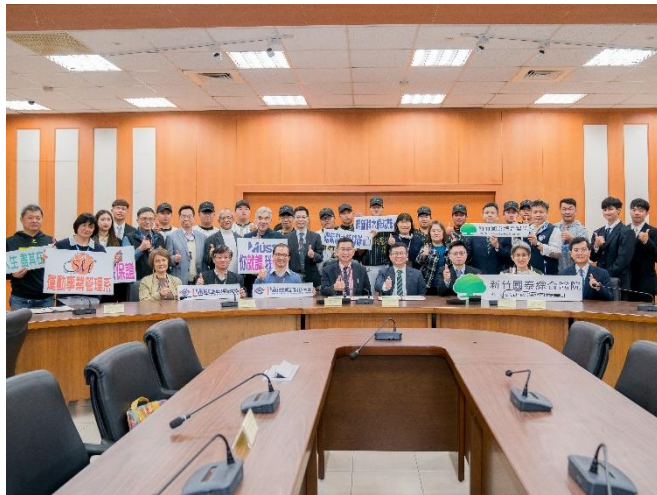
本校與新竹國泰綜合醫院簽署合作意向書，「疼痛暨運動醫學中心」開設預約專線提供運動代表隊同學健康及醫療照護，進行學術研究、人才培育等合作計畫。