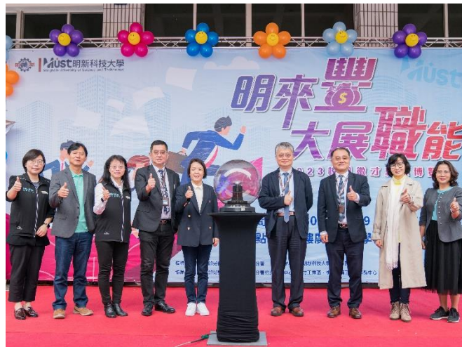
學務處諮商輔導暨職涯發展中心在校內宗山樓及明學樓前廣場，盛大舉辦2023 校園徵才就業博覽會，提供人才媒合最佳平台。