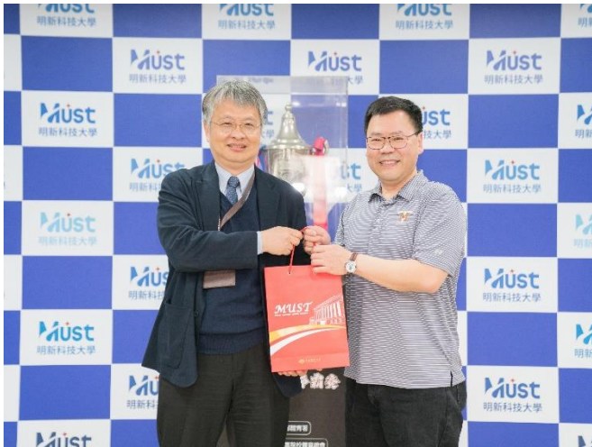
加拿大蒙大拿理工科技大學礦業與工程學院拜會參訪本校半導體學院。