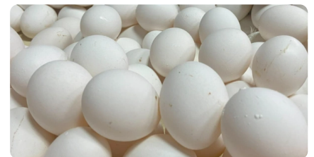
民代喊話：只是想知道誰賣的蛋 有那麼難嗎