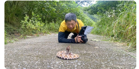
屏東爬山巧遇超「山神大人」興奮趴地合影