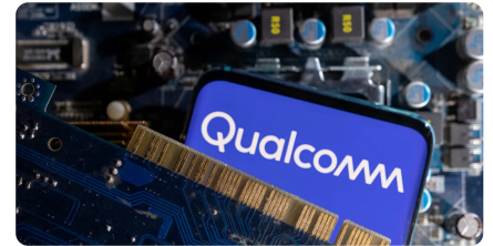
高通傳大規模裁員 證實「納入台灣」