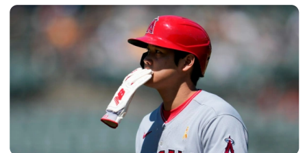
大谷手術內容沒說清楚 美媒：沒必要隱瞞