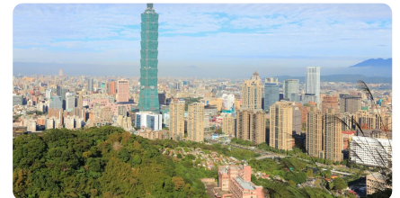
房貸年限全球排名 台灣排第7 第一名可繳105年