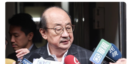
開刀適逢蛋風暴 忍痛拒拿拐杖備戰