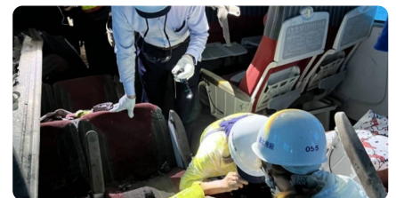
普悠瑪事故家屬：我們找到的物品比檢警還多