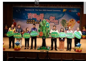
感謝教師用愛成就每位孩子 南市舉辦教師節表揚大會