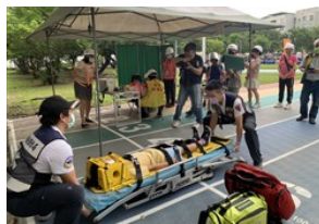
國家防災日 演練地震疏散建立避難意識