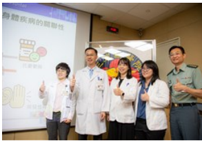
憂鬱症患者易罹乾癱 服抗憂鬱藥可降發生率