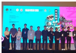
南華大學民音系揚名國際 獲大馬藝術節5金2銀佳績