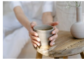
秋分養生調睡眠 白色食物聰明吃