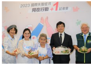
與失智者共好共老 全台「同在行動+1」