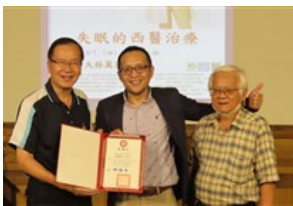
落實大學社會責任 南華邀精神科主任蘇建安談失眠治療