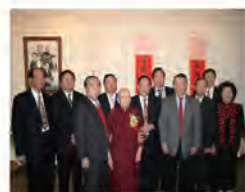
97.01.07 蘭花揚芬百年芳感恩結緣展。