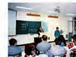
78.04.07 夜間部推廣教育日語班，在頭份華隆公司開班。