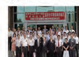
93.09.07 明道樓重建工程破土典禮。