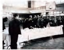
59.04.26 舉杯歡慶中正堂落成。