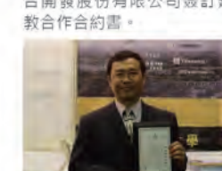
92.09.23 本校蟬聯 92 年度中國工程師學會建教合作績優單位獎。