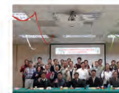
105.03.02 日商圖研捐贈本校 E3 電氣電子系統設計軟體。