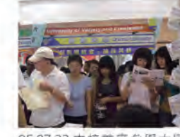
95.07.22 本校首度參與大學博覽會。