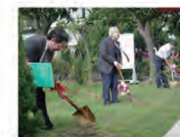
95.03.10 響應植樹節，舉辦校園植樹活動。