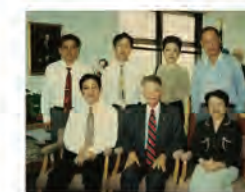
87.03.30 國際文化交流中心籌組「美國旅館事業管理學術訪問團」。