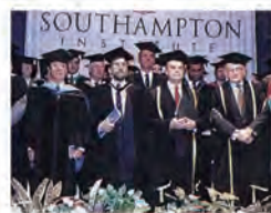
85.11.07 本校與英國南安普頓技術學院締結姐妹校。