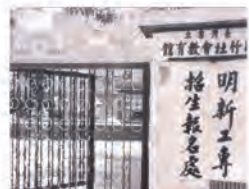
55.03.03 初期於社教館舉行招生。