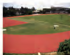
84.04.10 整修運動場，加做 400M 標準 PU 跑道。