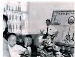
55.5.29 首屆董事會在本校會議室舉行。