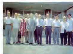
64.04.29 全國化工課程修訂會議 (17 校 21 人) 於本校舉行。