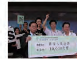
92.04.27 本校榮獲北區技博覽會最佳人氣獎。