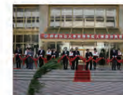
99.10.17 由本校原明道樓舊址改建的新教學大樓，舉行落成典禮，並正式揭牌，命名為「管理學院大樓」。