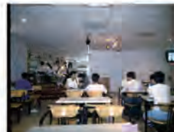
82.02.01 師生交誼廳正式啟用。