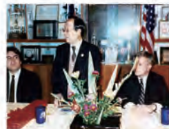
73.03.26 美國奧克拉荷馬州市立大學校長與董事長二人蒞校參觀。