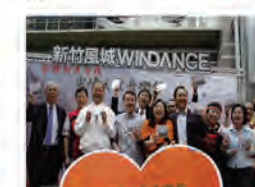
93.10.24 本校響應尖峰之愛音樂會募款活動。