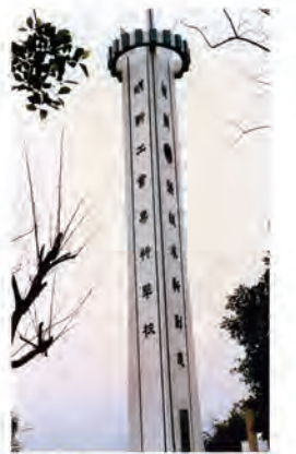
62.06.05 本校精神堡壘完工。