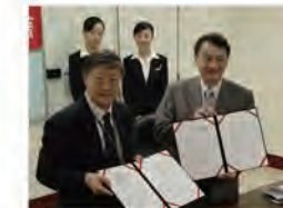
93.05.17 本校與東信電訊股份有限公司簽署無線寬頻校園資訊網路合作計畫。