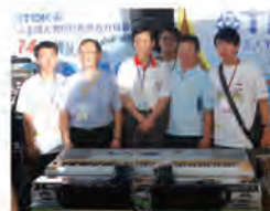
99.10.15 本校與上銀科技研發鋼琴機械人，為「第 14 屆 TDK 盃全國大專校院創思設計與製作競賽」決賽當天首度開場表演。