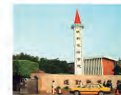
86.07.01 本校奉准改制為「明新技術學院」。