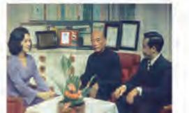
62.11.25 根據本校出資創校人張體安將軍軍話劇製作的「虎父虎子」電視劇，演出之前張將軍暨張紹鐸父子(右二人)接受中視記者(左)訪問。