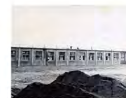
54.11.09 底樓施工完成之介壽樓(今明道樓)。