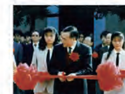
79.12.08 宗山樓由教育部長毛高文剪綵啟用。