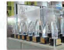
98.03.12 參加「第 3 屆國際微機構競賽」，獲 5 項冠軍，共 21 個獎項。