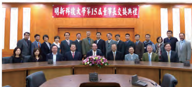
104.12.22 第 15 屆董事長交接典禮。