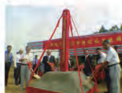
90.10.08 後山開發案動土典禮。