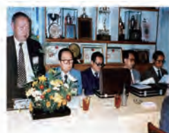
73.11.30 教育部第四次工專評鑑於本校評鑑。