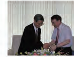
92.06.16 本校與新竹馬偕醫院簽署建教合作合約書。