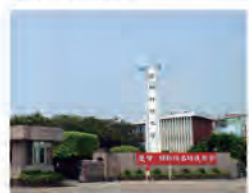
91.09.01 本校奉准升格為「明新科技大學」。