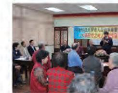
98.02.16 本校首度承辦教育部「老人短期學習計畫」為長青族開創多元學習管道。