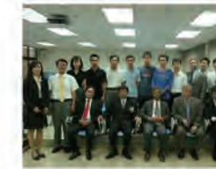
98.04.20 越南空中大學訪問團與本校越籍生(後排)合影。