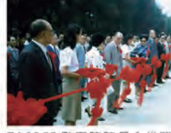
74.06.22 監察院院長余俊賢蒞校為右任紀念圖書館落成剪綵。