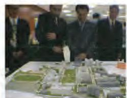
91.04.26 教育部蒞校進行改名科大訪視。