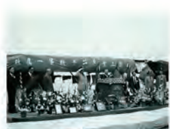
56.04.23 首屆校慶隆重中舉行。