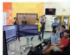
104.10.24 本校 49 週年校慶，首度舉辦創客嘉年華活動。