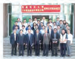
97.01.11 「士林電機廠股份有限公司」與本校簽約產學合作計畫。