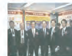
87.11.06 本校榮獲 87 年中國工程師學會頒發建教合作學校組績優單位。