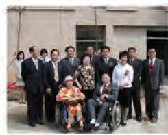
96.10.26 體安樓落成並舉行揭牌儀式。