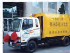
90.03.07 本校捐贈壓縮式清潔車一輛予新豐鄉。