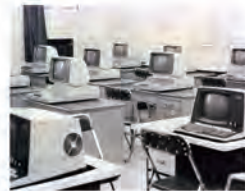
70.03.02 本校正式進入電腦新紀元。