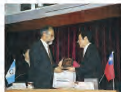
89.10.26 瓜地馬拉教育部梅西亞次長率團來訪。