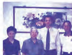
89.05.17 美國加州拉希勒大學副校長愛特派博士蒞校訪問。