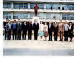
74.05.22 日本新力公司主管蒞校參觀。