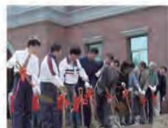
92.10.24 本校 37 週年校慶暨改制科技大學週年，植樹典禮。