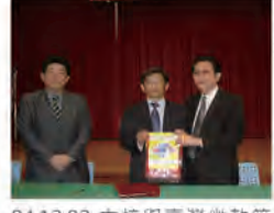
94.12.02 本校與臺灣微軟等訂微軟校園學生授權方案。