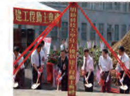
93.09.07 明道樓重建工程破土典禮。