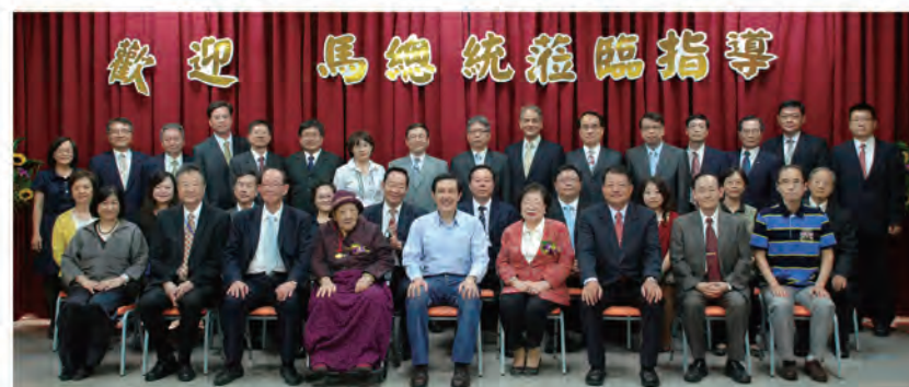
103.11.01 馬英九總統出席本校 48 週年校慶，會後與董事會暨全校行政主管合照。