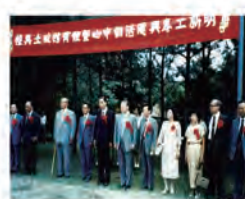
75.06.15 20 週年校慶，同時舉行活動中心及體育館破土典禮。