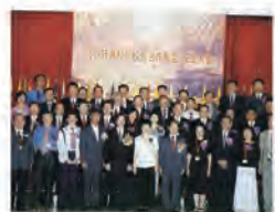
91.08.06 本校參加北區技專院校際合作聯盟。