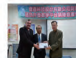
104.01.27 捷通科技與加拿大 Eleven Engineering 捐贈通訊發展系統給予本校電子系教學使用。