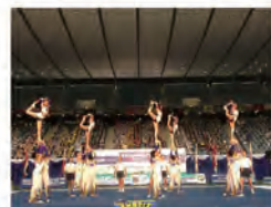
103.05.17 第 8 屆亞洲盃啦啦隊競賽冠軍。