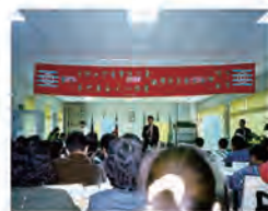
84.01.09 本校員生消費合作社正式成立。