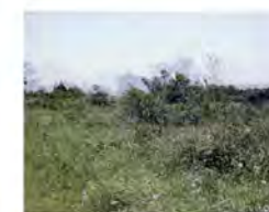
54.03.05 荒煙蔓草間，辛苦舉重建校工程。