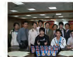
97.03.25 第二屆國際微機構競賽奪冠記者會。