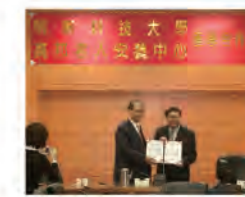
97.03.05 本校與萬邦社福基金會產學合作，簽約儀式於鴻超樓 1F 舉行。