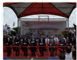
94.06.02 本校承辦 94 年度北一區全國技職校院博覽會。