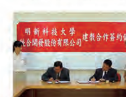
92.09.17 本校與統一集團統合開發股份有限公司簽訂建教合作合約書。