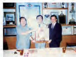
76.05.16 承辦 75 學年度夜間部工專聯招，表現優異，榮獲教育部頒獎。