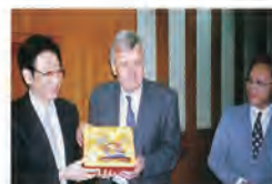
89.05.09 本校與英國葛萊茂根大學簽訂學術合作計畫。