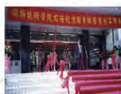
90.04.25 右任紀念圖書館改裝啟用。