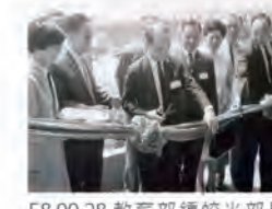
58.09.28 教育部鍾皎光部長為行政大樓落成剪綵。