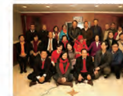
105.01.24 本校第 15 屆董事會首次會議，會後並舉辦「明新 50 蘭花 108」慶祝活動，與會人士合影留念。