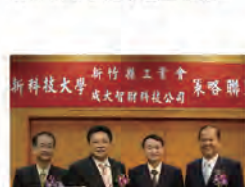
93.04.28 本校分別與新竹縣工業會及成大智財科技股份有限公司簽署策略聯盟。