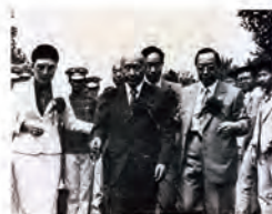
70.06.14 何應欽將軍蒞校為電腦中心剪綵。