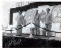
59.10.10 全國童軍大露營於本校舉行開幕典禮。