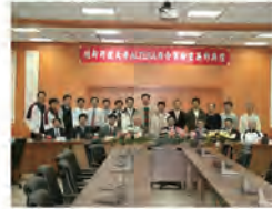
97.03.03 本校與 Altera 公司成立聯合實驗室，推廣可編程系統晶片設計及教學。