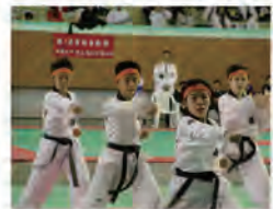
91.12.12 本校承辦第 27 屆全國中正盃跆拳道錦標賽。