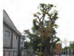
92.10.24 本校 37 週年校慶暨改制科技大學週年，栽植兩棵茄苳老樹於校園以茲紀念。