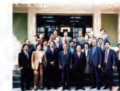
77.12.21 韓國昌原專門大學蒞臨本校訪問。