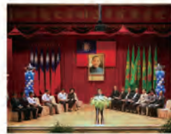
99.10.17 舉辦第 44 週年校慶暨運動大會。