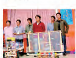
91.10.20 機械系榮獲大專院校創思設計與製作競賽冠軍、創意獎與 TDK 獎。