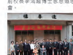
96.10.26 逢喜樓落成並舉行揭牌儀式。