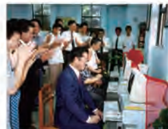
82.10.13 右任紀念圖書館舉行自動化啟用典禮。