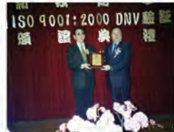
90.04.10 本校通「挪威 DET NORSKE VERITAS」ISO 9001:2000 檢驗。