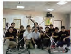
92.10.17 機械系勇奪「第七屆全國大專院校創思設計與製作競賽」冠、亞軍。