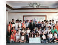
97.05.12 響應「送愛到四川」賑災聯合募款活動，本校師生代表展示獲頒之感謝狀。