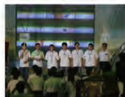
98.10.16 第 13 屆 TDK 盃全國大專校院創思設計與製作競賽。