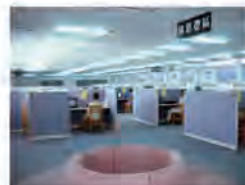
80.10.03 右任紀念圖書館學生自學中心正式啟用。