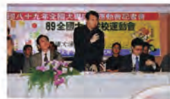
89.04.23 本校承辦 89 年全國大專院校運動會。