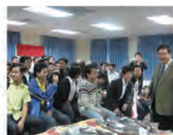
98.12.09 國際交流中心舉辦「國際師生年終歡慶會」。