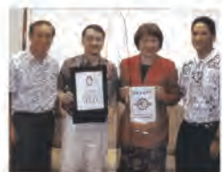
91.02.01 本校與美國夏威夷大學希羅分校建立姐妹學校關係。