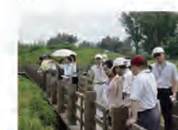
93.09.21 本校復育紅樹林成功。