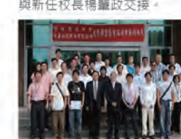
96.09.20 本校與技嘉科技舉行「產學聯盟暨電腦統購」簽約儀式。