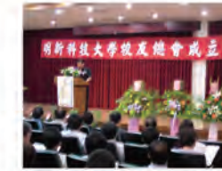
92.08.09 校友總會正式登記成立於本校並舉行成立大會。