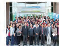
99.12.08 首屆「樂齡大學」開學典禮，在鴻超樓前師生合影。