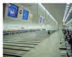
85.01.01 保齡球館竣工啟用。