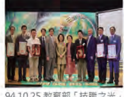
94.10.25 教育部「技職之光」頒獎表揚機械系師生。