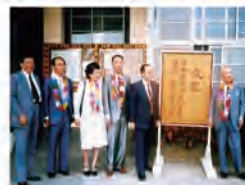
76.06.07 日本岡山理科學家計勉理事長一行來校觀禮。