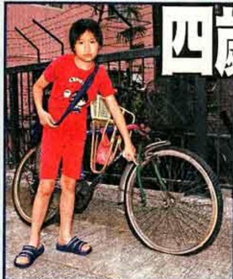
■受傷女童姊指著妹妹腳部被夾單車位置，座椅前有一個加裝的藤座位。