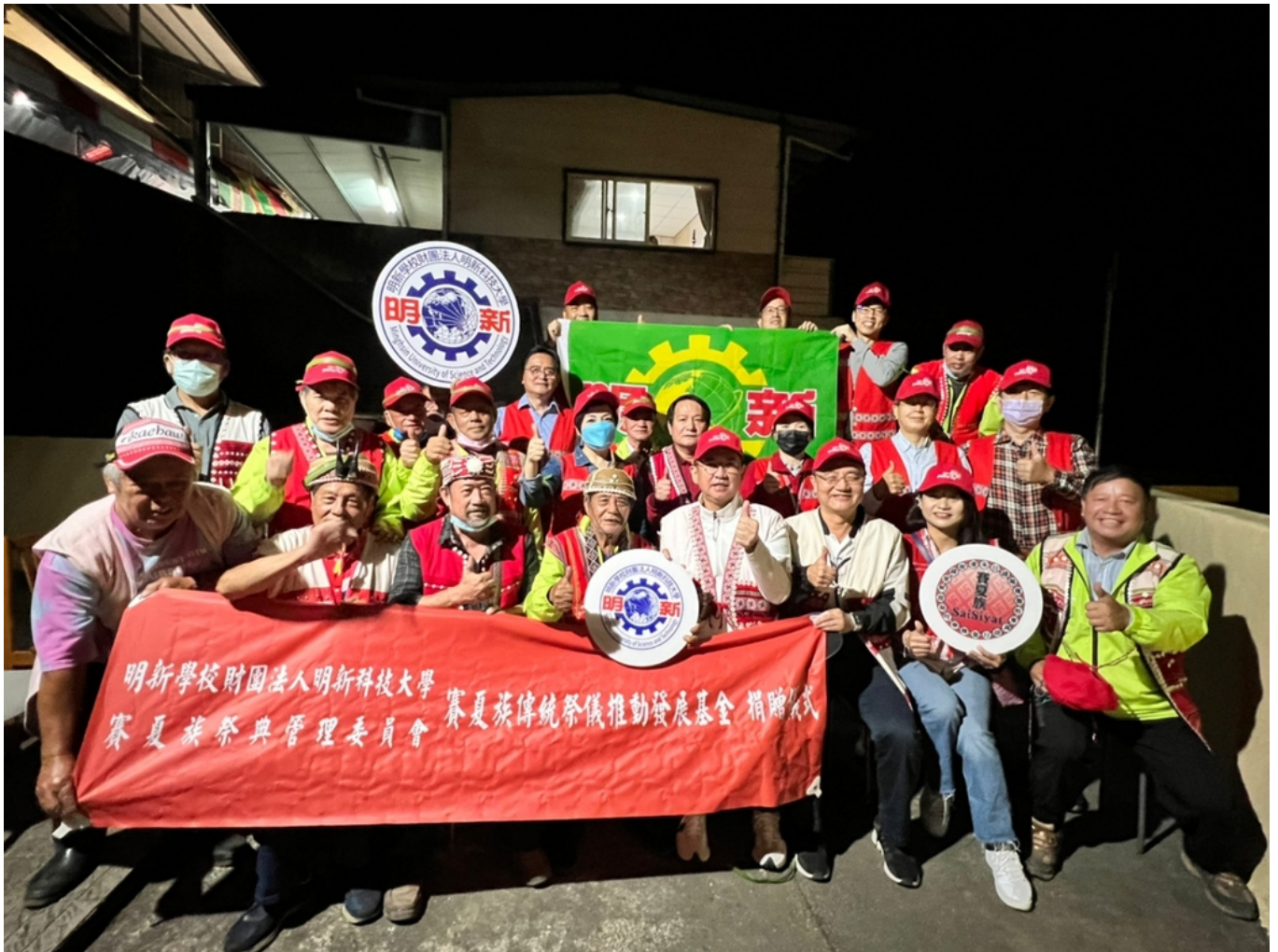
《圖說》明新科大一級主管團隊深入新竹縣五峰鄉，參訪賽夏族傳統祭典矮靈祭。