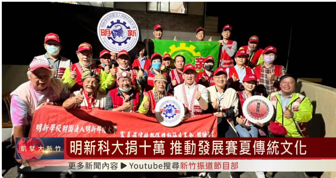
五峰鄉賽夏族矮靈祭 年輕族人踴躍參加祭典 | 明新科技大學捐十萬 推動發展賽夏傳統文化