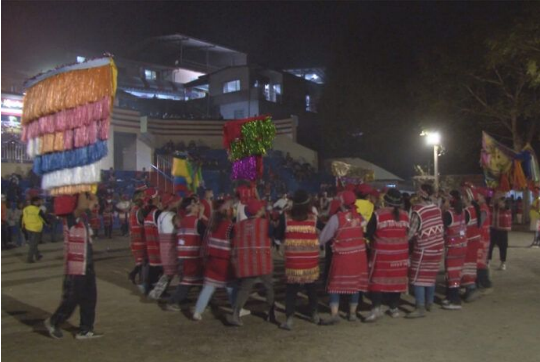
▲五峰鄉賽夏族矮靈祭，年輕族人踴躍參加祭典。