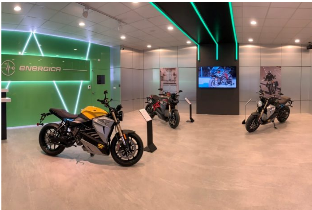
明新科大將舉辦永續行動市集，推廣SDGs、ESG永續城市概念，將展出校友臻裕企業獨家代理的義大利電動重型機車