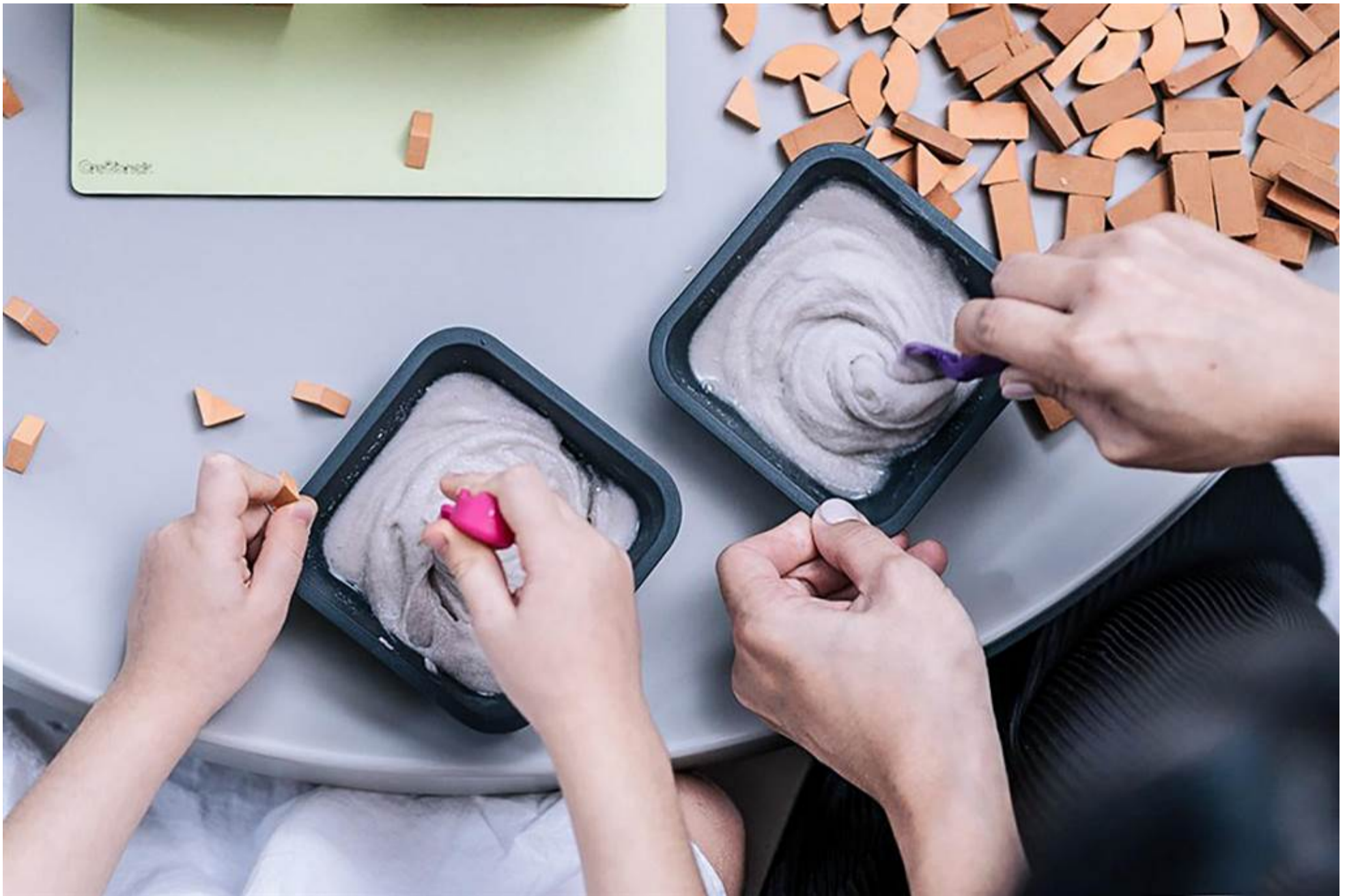
明新科大將舉辦永續行動市集，「玉龍龍積木磚」親子創意手作DIY活動，可體驗傳統砌磚工法的創新積木。

明新科大響應新竹縣綠能產業科技化與智慧AI化的永續城市目標，12日將在縣府前廣場舉辦「青春環保ESG·永續行動ING嘉年華」活動，有電動車與綠能廠商展示、親子創意手作DIY及在地小農市集三大主題聯合展出。