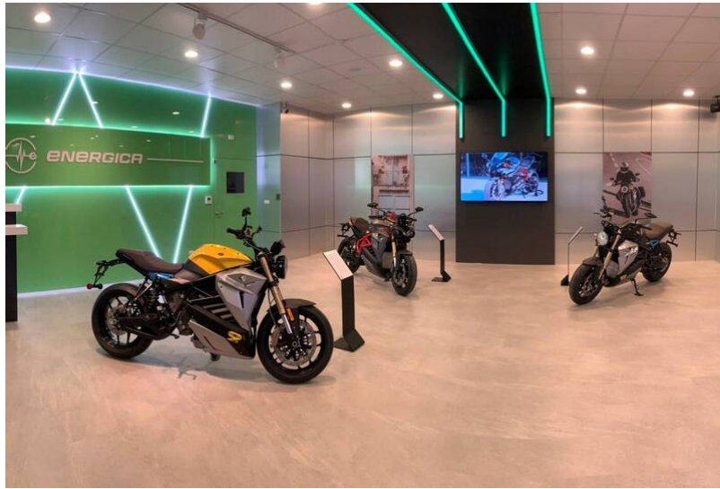
「青春環保ESG·永續行動ING嘉年華」活動，週六（12日）下午下午2點到4點將於新竹縣政府前廣場登場，將展出校友臻裕企業獨家代理的義大利電動重型機車。

小農市集則集合明新科大USR計畫輔導小農成果，包括：大口吃米、MIT蜂蜜、璞玉瑞招農場、怡農茶園、蜜王養蜂園、不二農場、曲辰農園、新竹青年農民、那羅灣休閒農業區、木酢達人，也有「農藥快篩站」，民眾可帶著家裡的青菜蔬果到場免費篩檢。