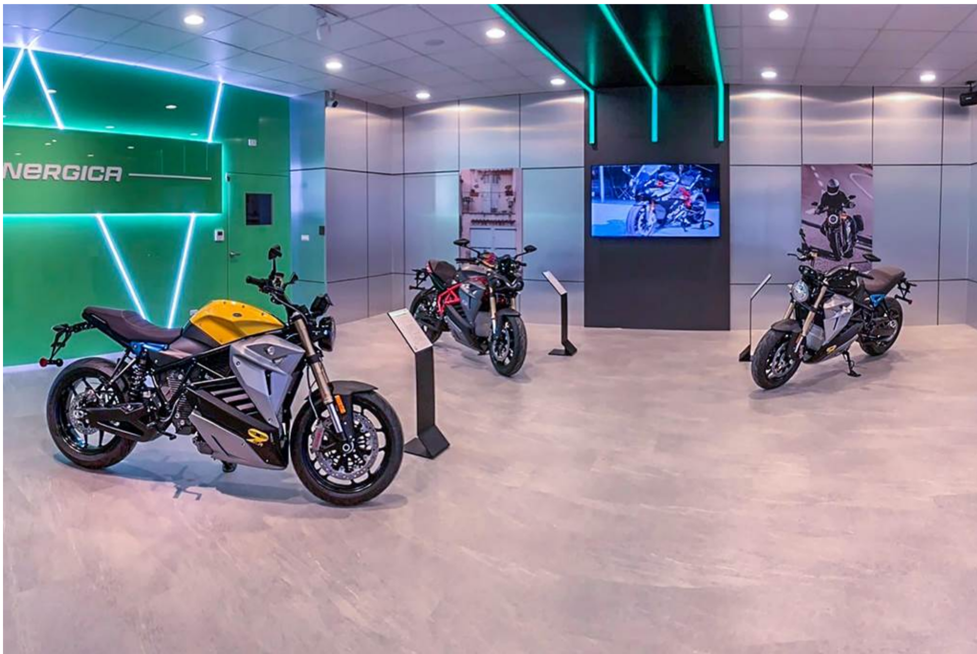
明新科大舉辦永續行動市集，將展出校友臻裕企業代理的義大利電動重型機車。