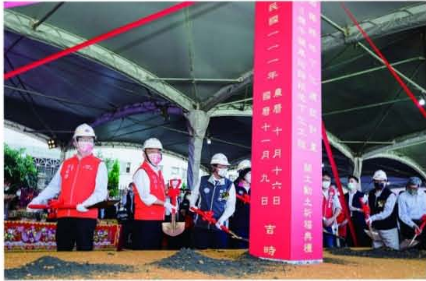
「平鎮車站路段地下化工程」開工動土祈福典禮。

工啟用，平鎮市民將可提早50個月享受到鐵路運輸服務，同時也可分散鐵路地下化施工期間中壢車站運輸壓力。 捷運局陳局長表示，桃園鐵路地下化計畫在今年4月1日通過工程會基本設計審議，目前主體工程已陸續上網招標中，依鐵道局規劃期程，中壢、桃園及內壢車站將於118年切換通車，包含平鎮的其餘通勤車站則於119年啟用。