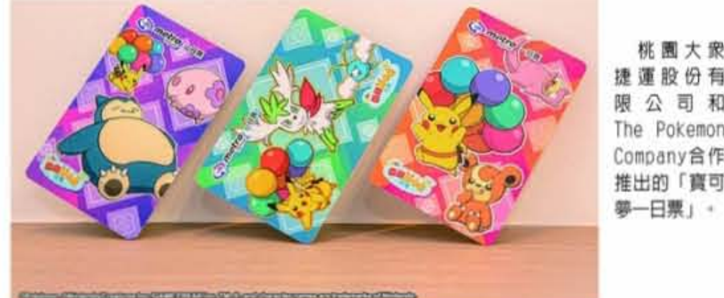
桃園大眾捷運股份有限公司和The Pokemon Company合作推出的「寶可夢一日票」。

務，每人限3套，線上預購活動至11月20日止，並於12月8日至12月16日可至選擇車站取票。 桃園大眾捷運(股)公司和The Pokemon Company自10/21合作推出「飛翔皮卡丘計畫」，包括有「飛翔皮卡丘彩繪列車」及「寶可夢一日票」都廣受寶可夢迷喜愛，第一批「寶可夢一日票」500組套票短短兩天不到即銷售一空，讓想收藏的寶可夢迷們扼腕。 另外，第二批「寶可夢一日票」500組套票，也即將到貨，想搶先擁有的寶迷也可以在11/25日起到各車站詢問處購買。