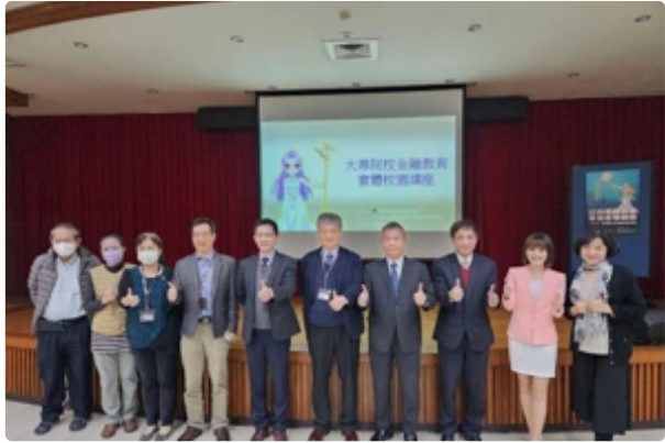
證交所前進明新科技大學辦理校園專題講座