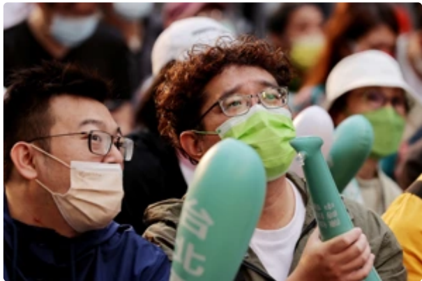
造勢熱不解為何大輸 綠競選總幹事檢討：年輕人不投票是敗選因...