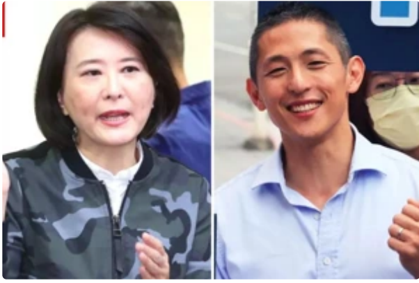
最新北市立委補選民調出爐 媒體人曝「這因素」將成勝選關鍵