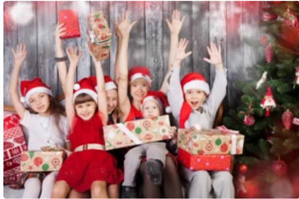
耶誕節送愛給家人！買保險「財富傳承」的禮物最棒