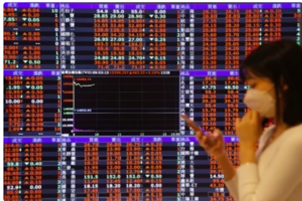
材料盤中登千元...台股高價股熱閃見八千金