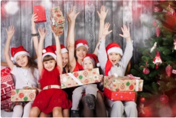
耶誕節送愛給家人！買保險「財富傳承」的禮物最棒