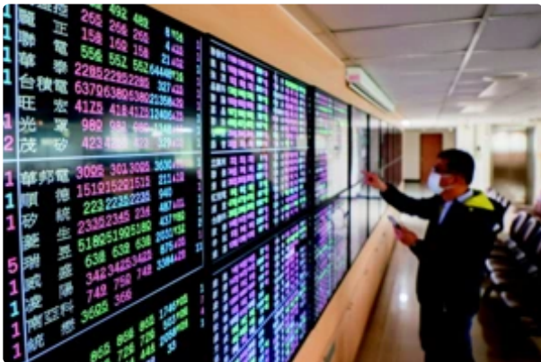
台股早盤小跌續戰16,800點 台積電下跌4元開553元