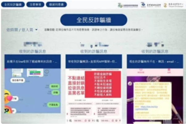
金融投資詐騙民眾有感 證交所舉辦網路分享活動抽i14 Pro