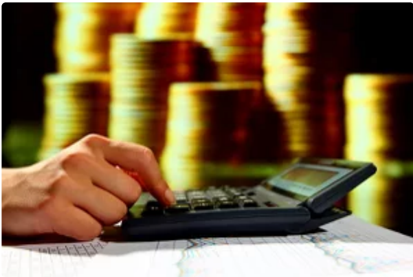
達興材 強攻半導體新材料