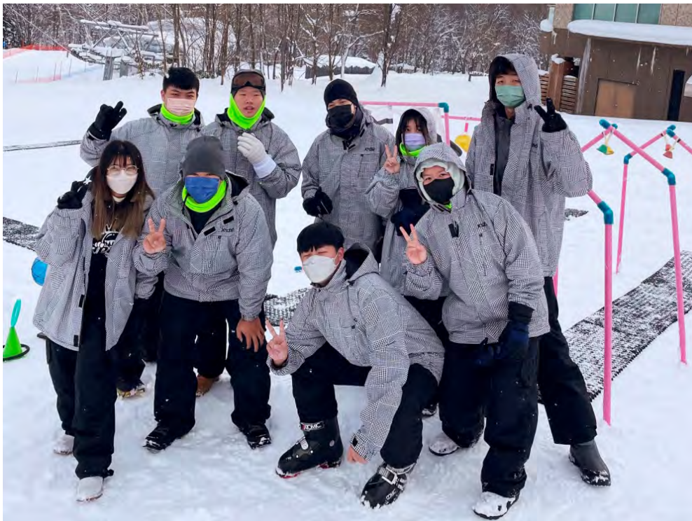
▲疫後開放，明新科大重啟海外實習，透過教育部學海築夢計畫補助學生前往日本滑雪場實習，認識滑雪運動產業，以及提升語言能力，增進國際視野。

在國際疫情趨穩，迎接疫後觀光旅遊產業的復甦，明新科技大學啟動「學海築夢」海外實習計畫，選送26位運動事業管系、應用外語系學生，前往日本雪場進行兩個月的實習，培育國際休旅運動人才。