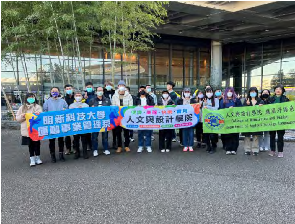
明新科大重啟海外實習，人文與設計學院選送學生前往日本滑雪場實習，以培育國際休旅人才。

提供實習機會的YKT渡部社長表示，渡部說，明新科大的實習學生們在雪場表現優秀，短短兩個月的實習工作，已成為不可或缺的夥伴，二月初實習雖已結束，希望未來畢業能來日本一起投入運動休旅觀光產業。