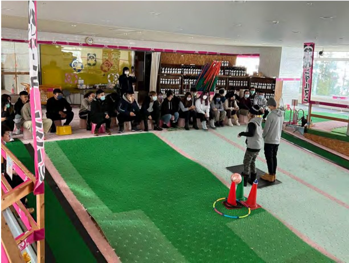
明新科大與日本YKT株式會社合作學生雪場實習，學生在熊貓滑雪學校接受培訓上課。