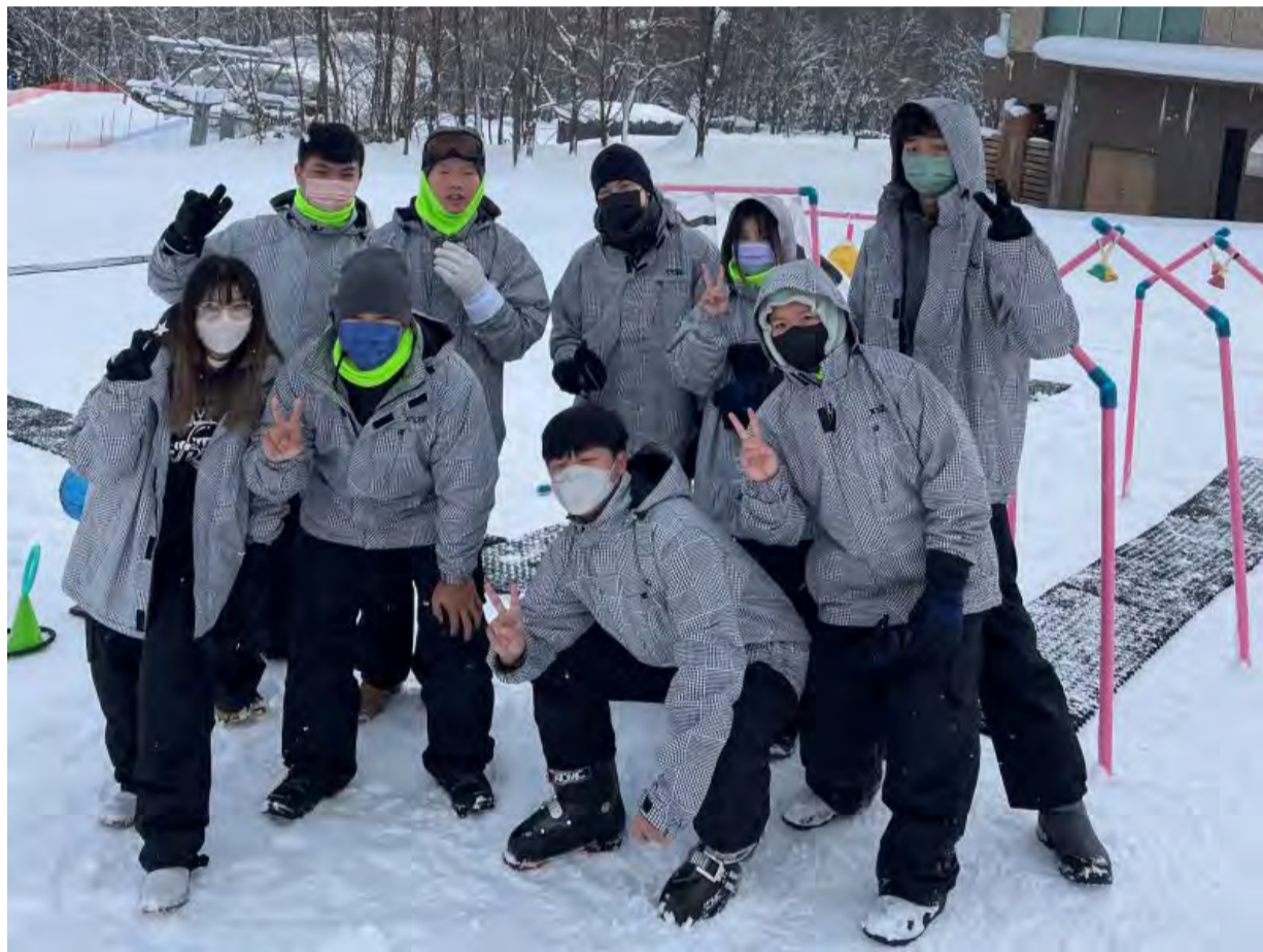
明新科大疫後重啟海外實習，透過教育部學海築夢計畫補助學生前往日本滑雪場實習，認識滑雪運動產業，以及提升語言能力，增進國際視野。

國際疫情趨穩，迎接疫後觀光旅遊產業的復甦，明新科技大學啟動「學海築夢」海外實習計畫，選送26位運動事業管理系、應用外語系學生，前往日本雪場進行兩個月的實習，培育國際休旅運動人才。