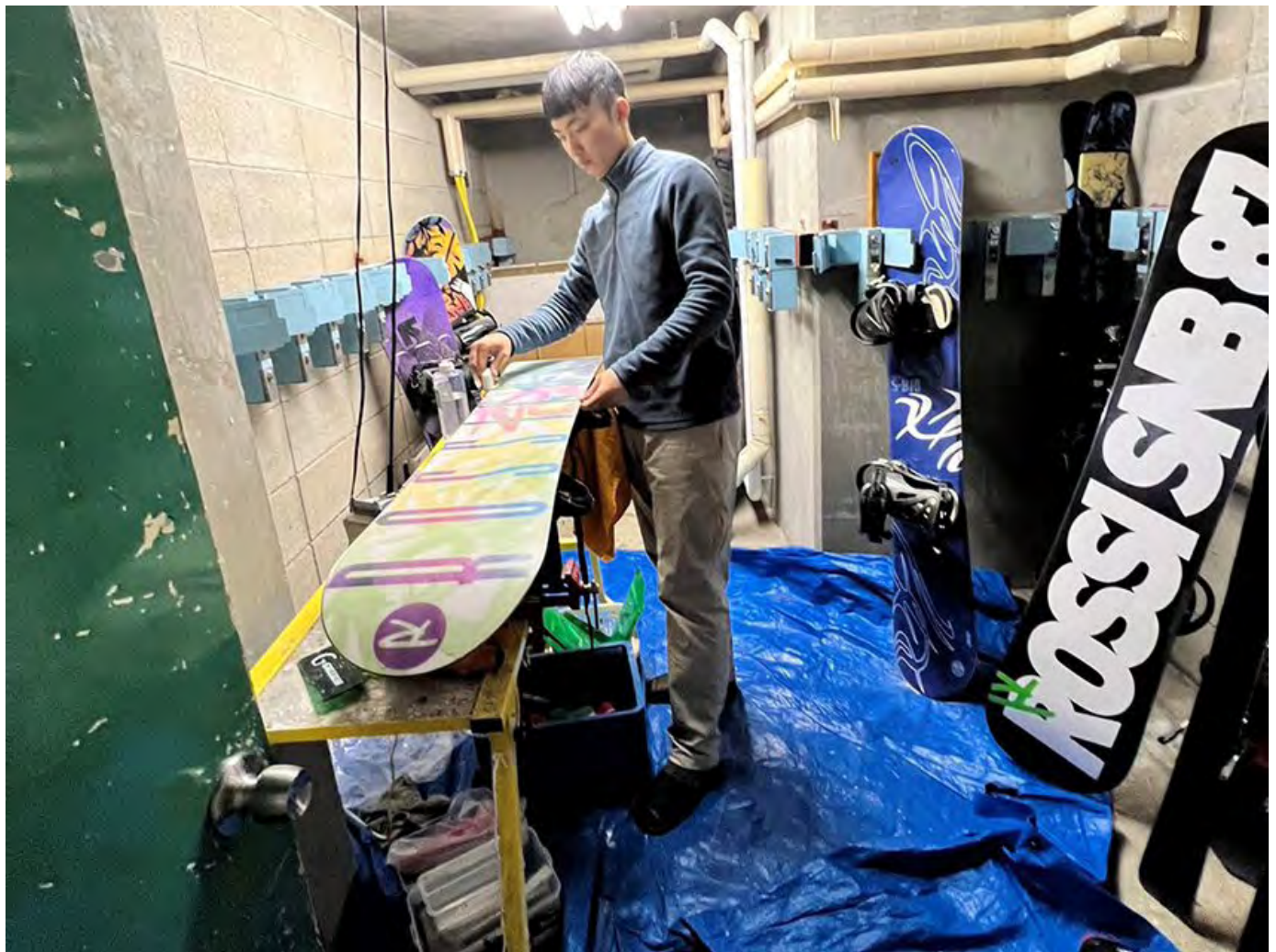
明新科大與日本YKT株式會社合作，提供學生在滑雪場實習機會，圖為學生在雪具店為雪板進行保養工作。