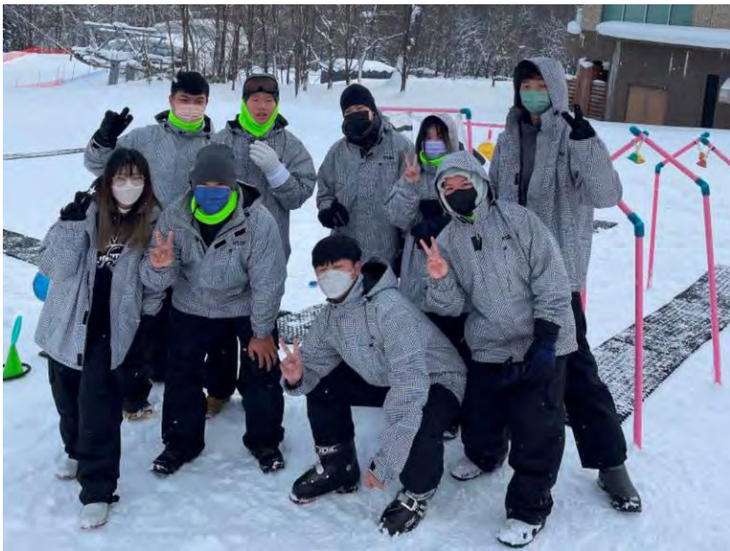
▲明新科大透過學海築夢計畫補助學生前往日本滑雪場實習，增進國際視野。