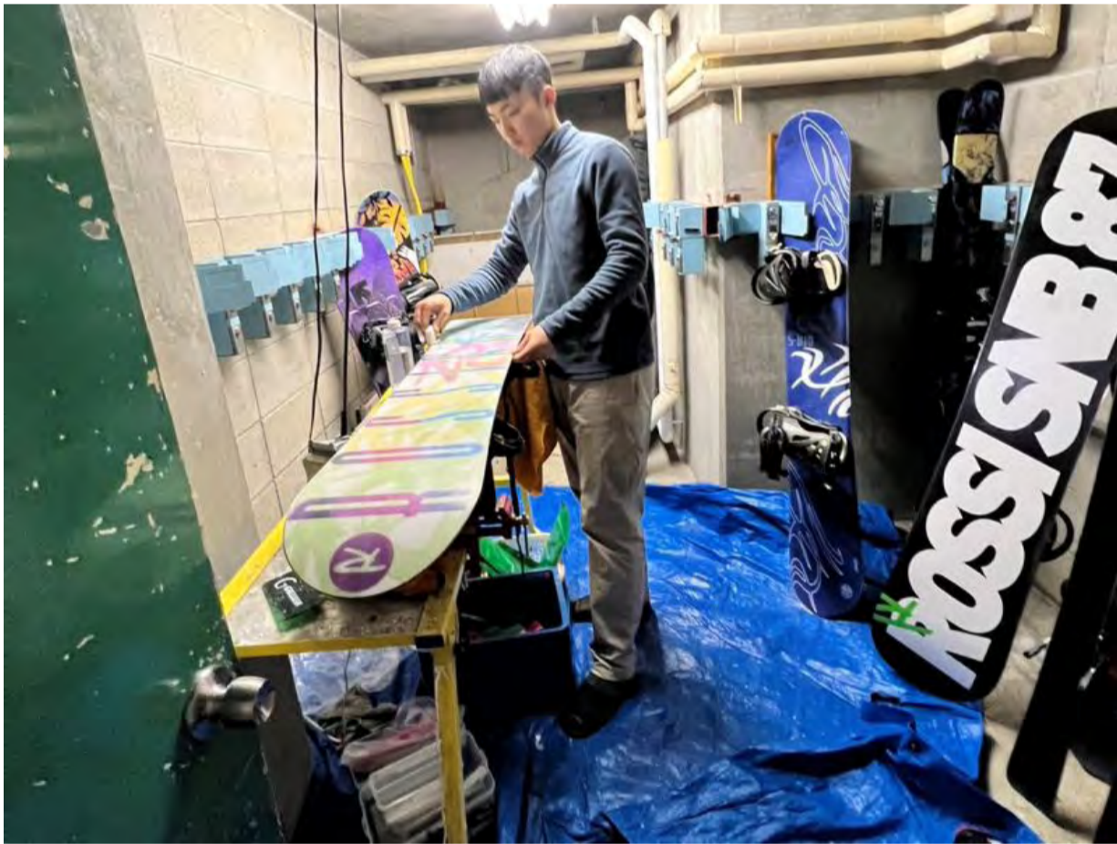
明新科大與日本YKT株式會社合作，提供學生在滑雪場實習機會，圖為學生在雪具店為雪板進行保養工作。