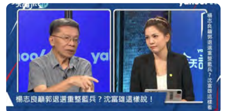
楊志良願郭退選重整藍兵？沈富雄這樣說！