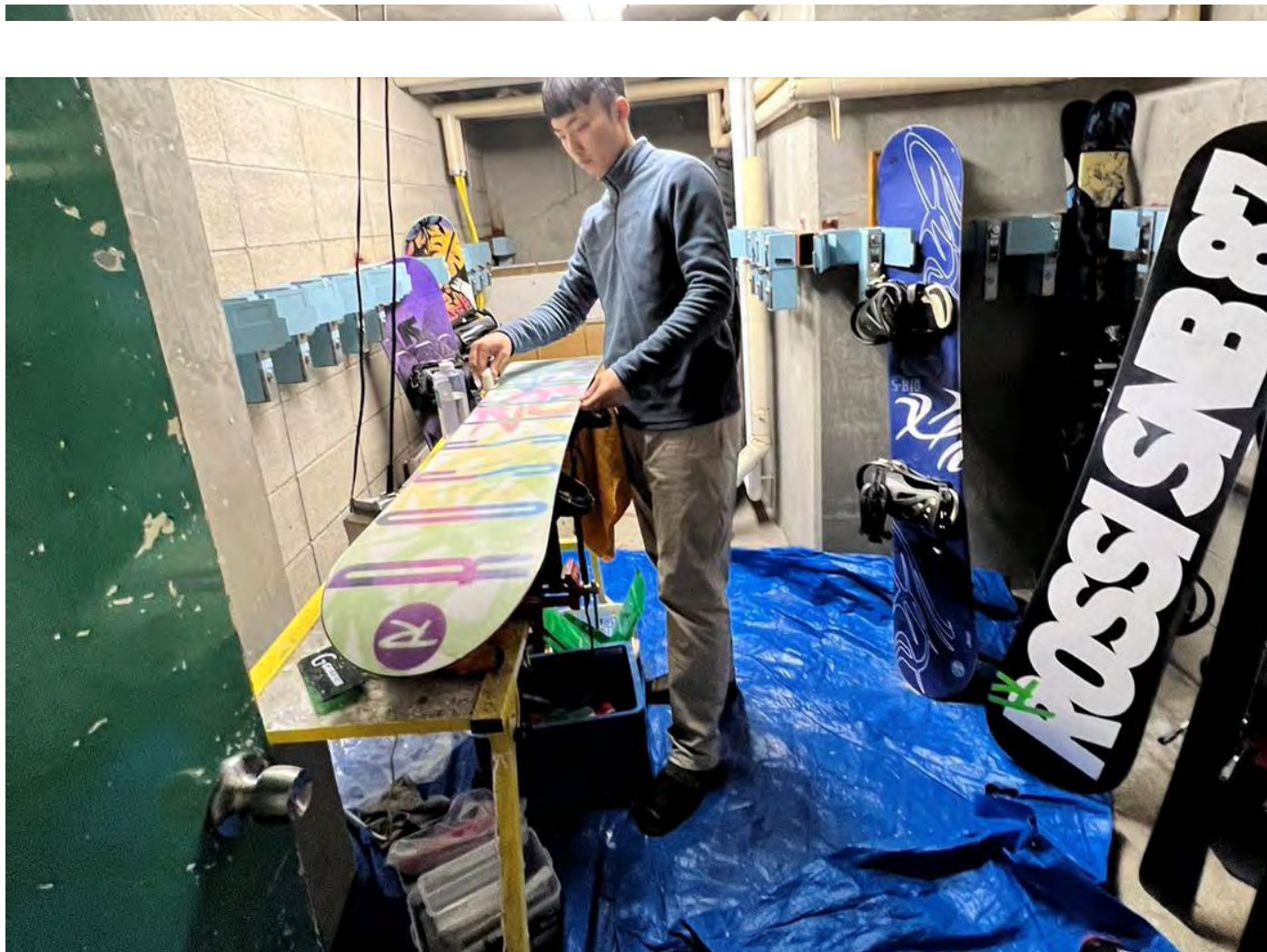
明新科大與日本YKT株式會社合作，提供學生在滑雪場實習機會，圖為學生在雪具店為雪板進行保養工作。

明新科大向副院長指出，在疫後解封，受國人喜愛的日本旅遊即將爆發性成長，也剛好是日本滑雪季，看好滑雪產業發展與滑雪業界人才的需求，能與日本YKT和KRT滑雪學校合作，提供學生出國實習，透過教育部學海築夢方案補助學生經費，讓學生在國外工作，實地在滑雪場進行學習及發揮專長，提升自信與累積國際化能力，也從自身經驗來推廣滑雪運動，吸引更多民眾投入滑雪休旅運動。