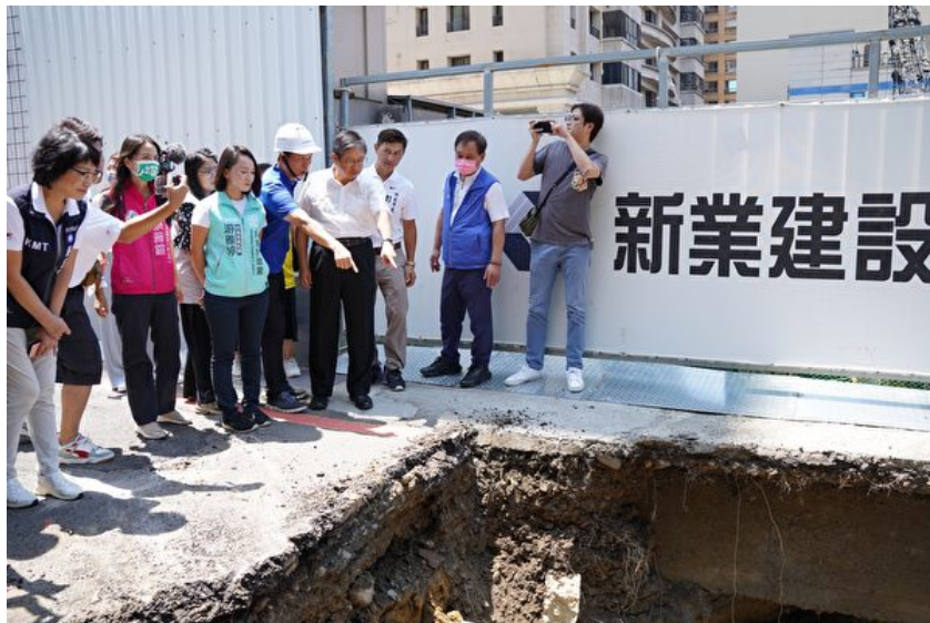
新竹縣政府對面建案旁路面塌陷出現天坑，造成自來水管、瓦斯管破裂，新竹縣長楊文科（右4）要求旁邊建商工地停工，徹底調查原因。