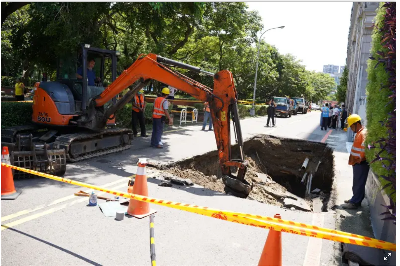
▲縣府工務處要求建商盡速搶險回填，確實改善。