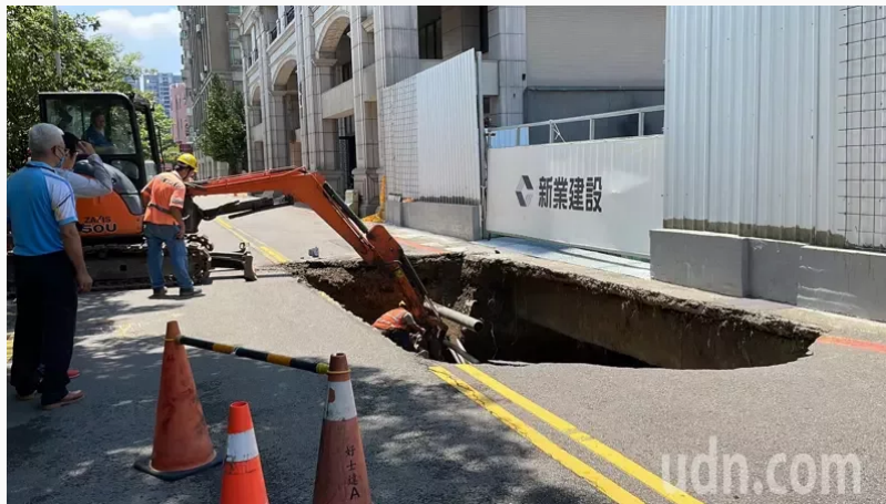
距離新竹縣政府僅300公尺的光明六路與縣政七街，今天上午裂出一個長6公尺、寬3公尺深度近3公尺的「天坑」。