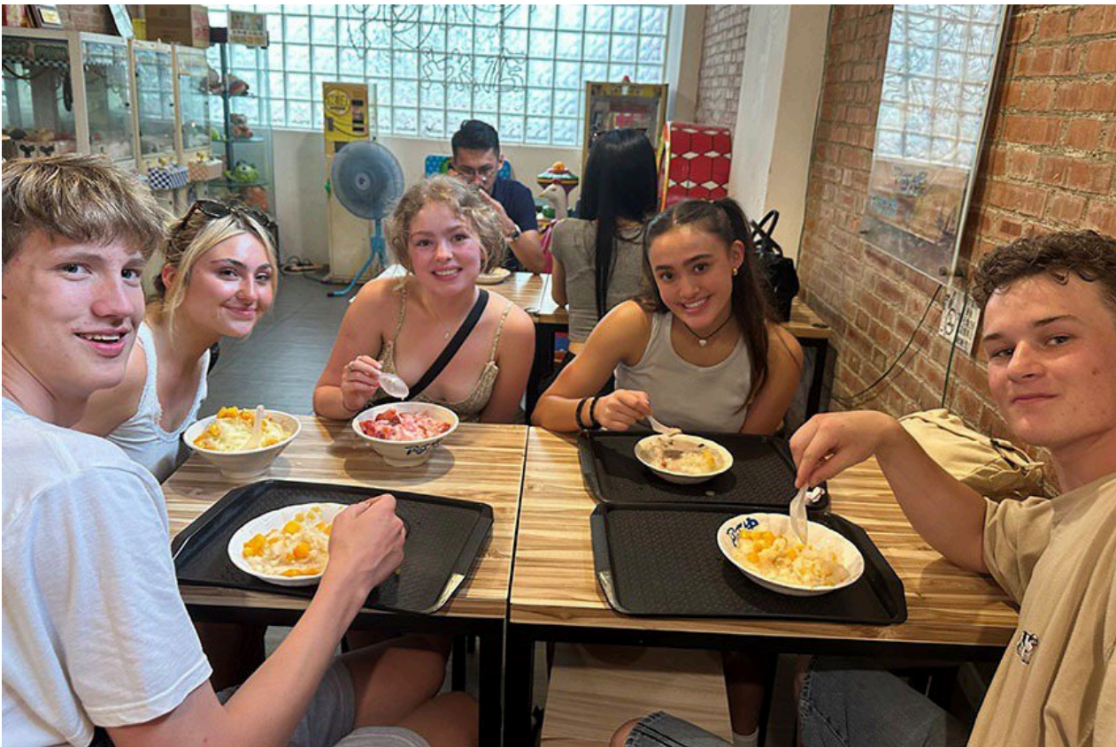
美國猶他州高中生華語研習團在明新科大進行兩週的華語學習，30日下午學員前往新竹城隍廟，品嚐廟口美食芒果冰。