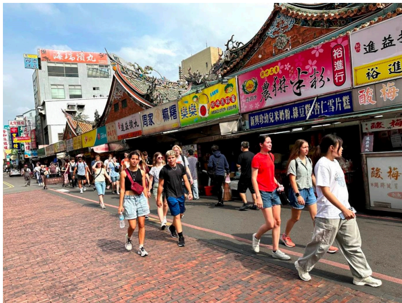
《圖說》美國猶他州高中生華語團30日下午前往新竹城隍廟踩點，認識台灣的傳統文化及新竹的歷史風貌。