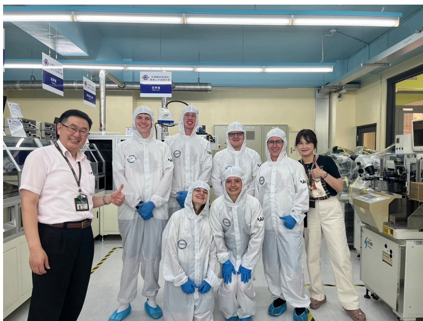
《圖說》美國猶他州高中生華語團參觀明新科大半導體人才培育基地，及穿無塵衣體驗半導體廠房生態。