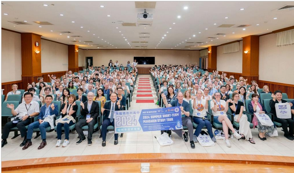
《圖說》美國猶他州高中生華語研習團再次造訪台灣，前往明新科大進行為期兩週的華語學習。