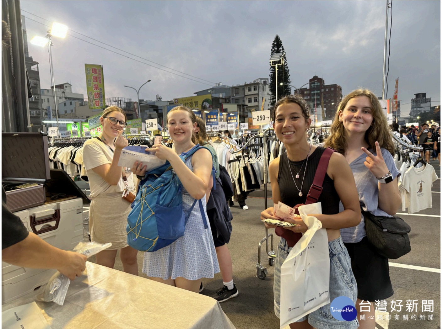
美國猶他州高中生華語研習團學員們30日晚上勇闖新竹後站夜市，實地用華語購物消費。

美國猶他州Skyridge、Westlake、Lehi、Lone Peak和Orem等五所高中的105名高中生、老師及隨隊家長，於5月27日至6月7日再次造訪台灣，在新竹的明新科技大學展開兩週的短期華語學習。研習團的學員均已具備基礎華語溝通能力，對認識台灣文化充滿期待。