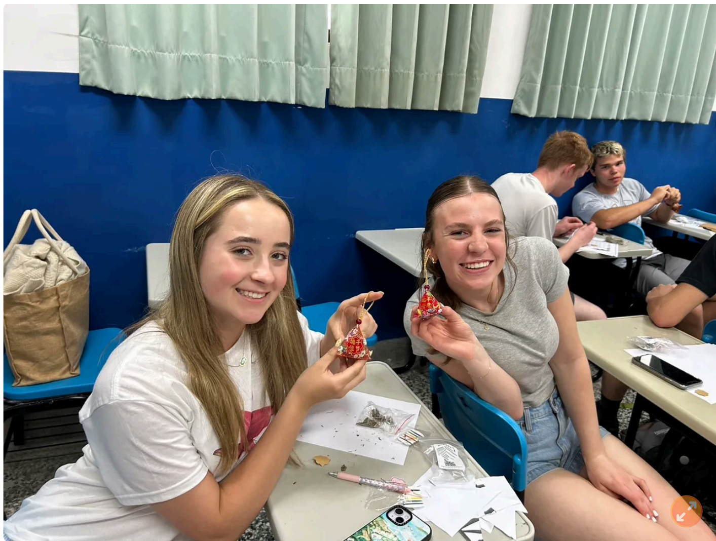
校方安排端午节的香包DIY制作。

除了课堂的学习，研习团也走访新竹城隍庙老城区，认识台湾的传统文化和生活方式及新竹的历史风貌。在城隍庙，学员们对台湾的宗教信仰和民俗文化感到好奇。过程中，学员们运用课堂上学习的华语与当地民众交流，购物、品尝新竹的米粉、贡丸汤、芒果冰等庙口美食，接著前往巨城、后站夜市逛街当「一日新竹人」。