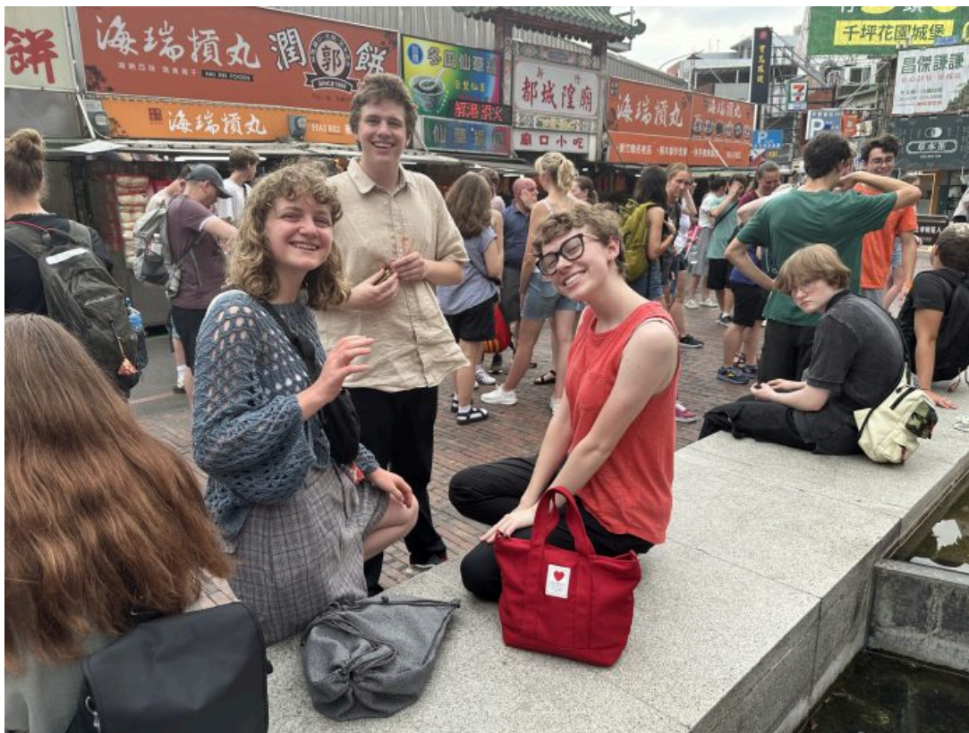
美國猶他州高中生華語研習團至新竹城隍廟，品嚐傳統小吃及欣賞廟宇之美。

明新科大規劃學員參與校園活動與明新科大學生互動，提升華語對話實戰經驗。像是與原住民同學一起跳舞、參加英語歌唱比賽當表演嘉賓，還有一起上排球體育課，及跟籃球校隊友誼賽等，也安排蔥油餅、鳳梨酥，及端午節香包的製作體驗。研習團也參觀校內半導體人才培育基地，學習產業關鍵字的華語外，同時穿上無塵衣體驗晶片製作過程，並戴上混合實境頭戴裝置操作半導體廠務系統，學員們直呼大開眼界。