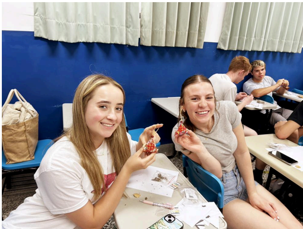
▲美國猶他州高中生再次組團前來明新科大進行華語學習，課程安排端午節的香包DIY製作。

在駐舊金山教育組的牽線與教育部的補助下，來自美國猶他州Skyridge、Westlake、Lehi、Lone Peak和Orem等五所高中的105名高中生、老師及隨隊家長，於5月27日至6月7日再次造訪台灣，在新竹的明新科技大學展開兩週的短期華語學習。研習團的學員均已具備基礎華語溝通能力，對認識台灣文化充滿期待。