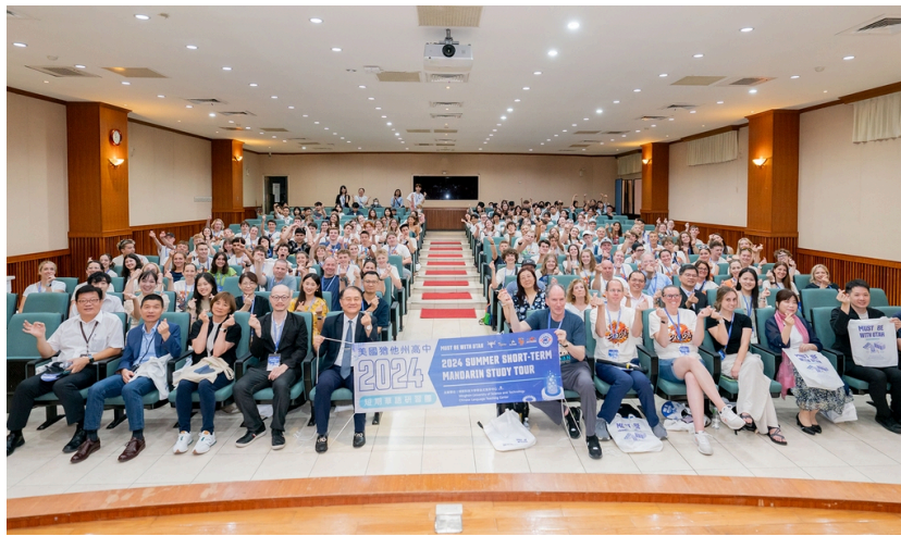
《圖說》美國猶他州高中生華語研習團再次造訪台灣，前往明新科大進行為期兩週的華語學習。