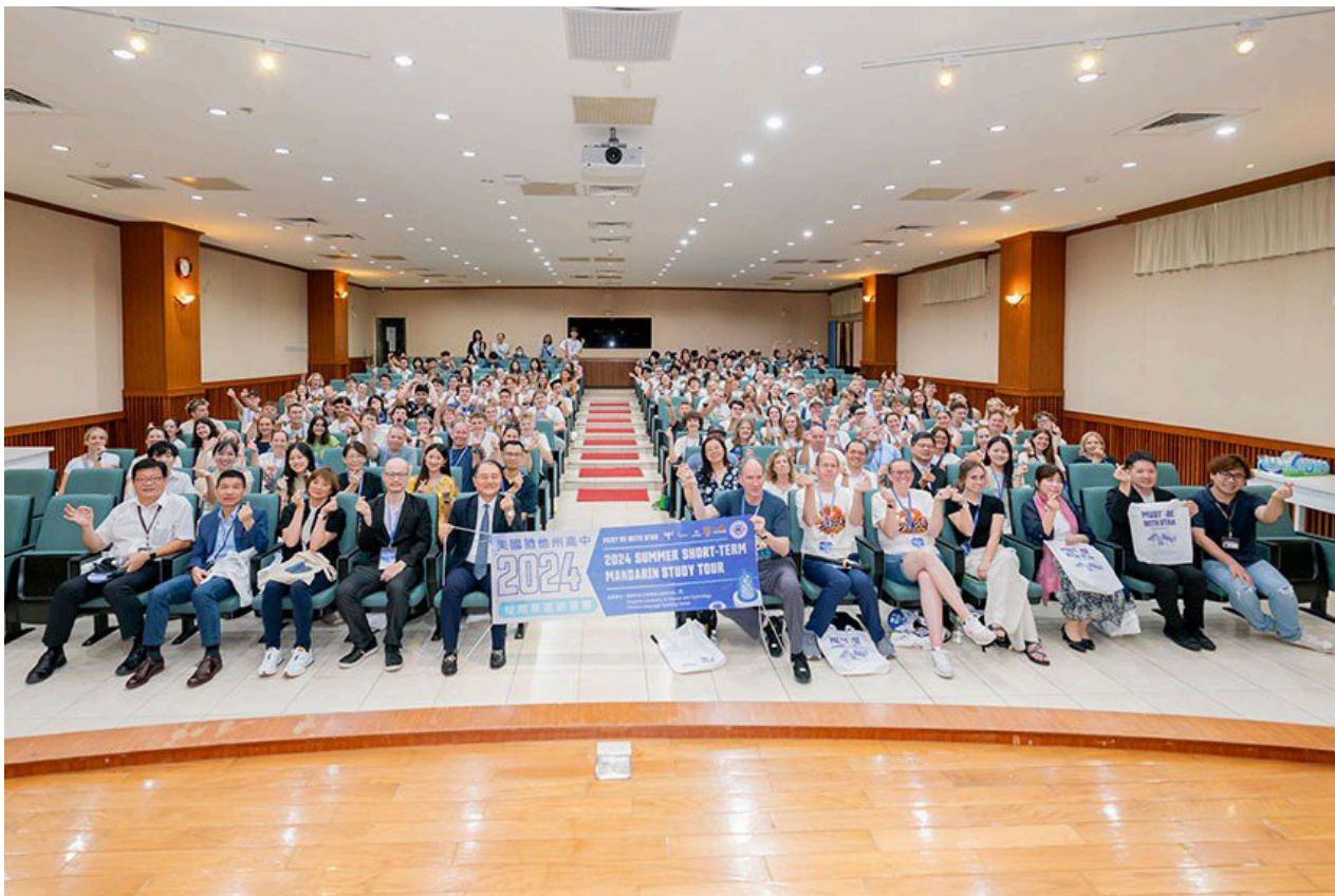
美國猶他州高中生華語研習團本週再次造訪台灣，前來明新科大進行為期兩週的華語學習。

在駐舊金山教育組的牽線與教育部的補助下，來自美國猶他州Skyridge、Westlake、Lehi、Lone Peak和Orem等五所高中的105名高中生、老師及隨隊家長，於5月27日至6月7日再次造訪台灣，在新竹的明新科技大學展開兩週的短期華語學習。研習團的學員均已具備基礎華語溝通能力，對認識台灣文化充滿期待。