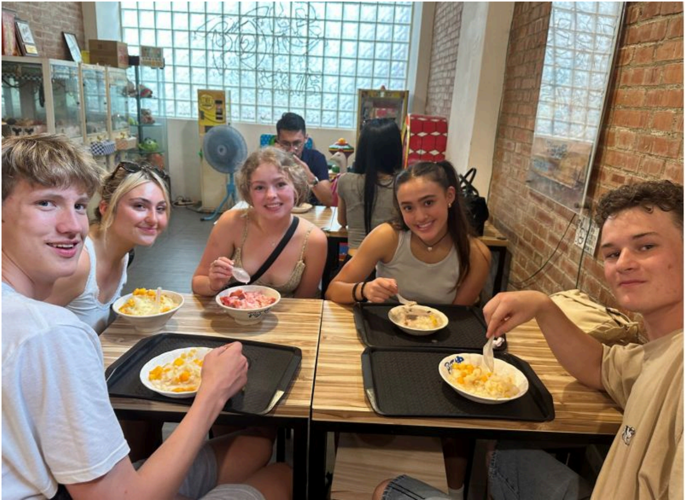
城隍廟口呷芒果冰