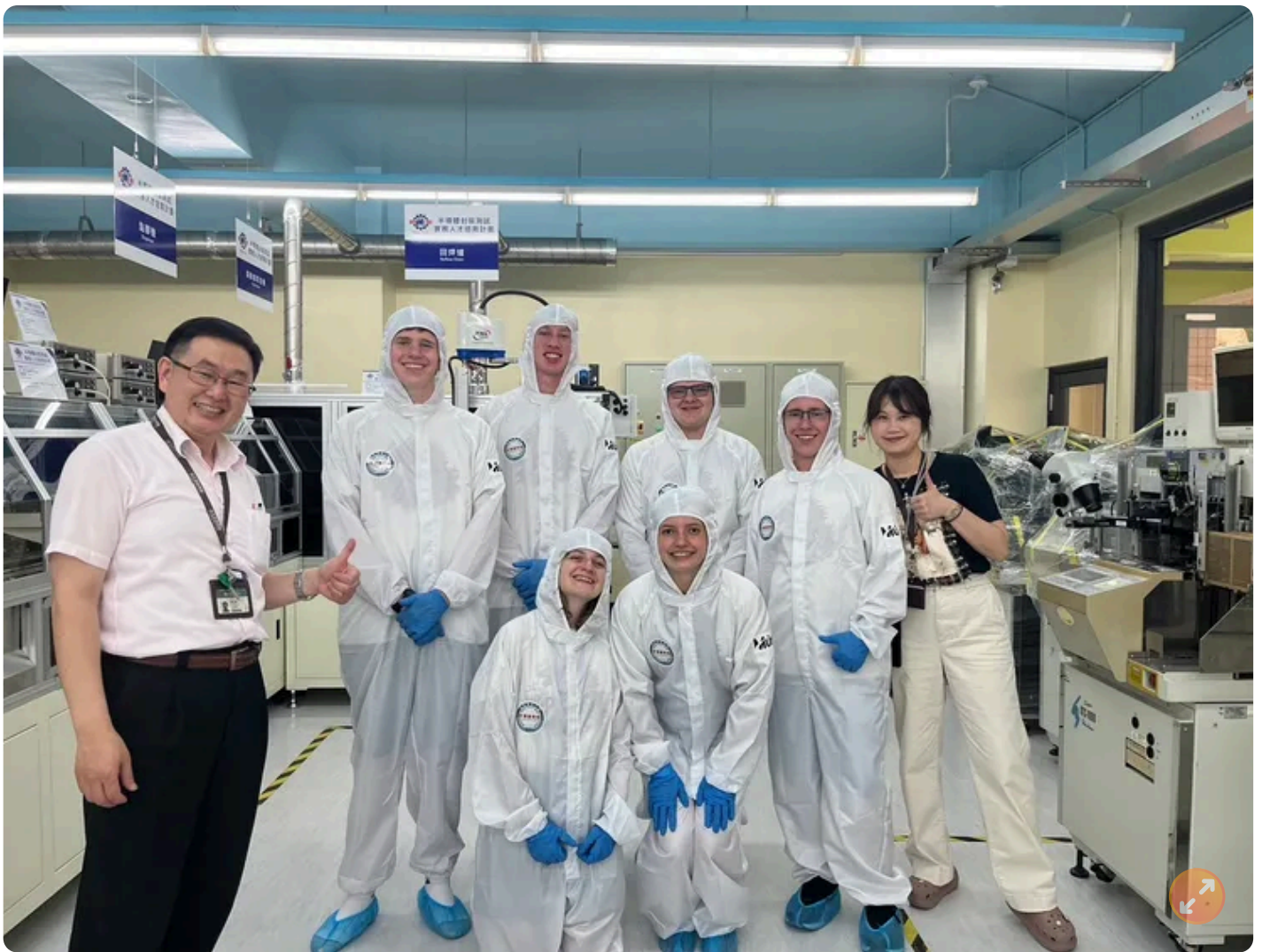
参访学生穿上无尘衣体验晶片制作过程，戴上混合实境头戴装置操作半导体厂务系统。

【记者张沛森 / 新竹报导】来自美国犹他州Skyridge、Westlake、Lehi、Lone Peak和Orem等5所高中的105名高中生、老师及随队家长，造访位于新竹的明新科技大学展开两周的短期华语学习。校方也安排应景的端午节香包制作体验、参观校内半导体人才培育基地，学习产业关键字的华语外，同时穿上无尘衣体验晶片制作过程，戴上混合实境（mixed-reality）头戴装置操作半导体厂务系统，学员们直呼大开眼界。