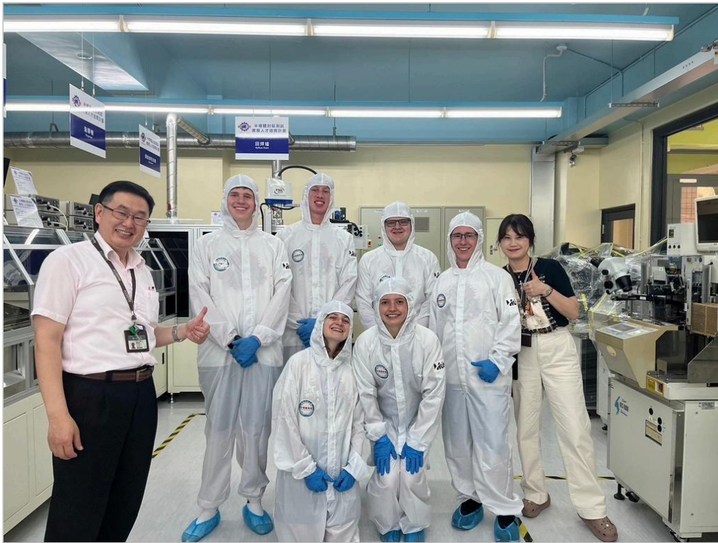
《圖說》美國猶他州高中生華語團參觀明新科大半導體人才培育基地，及穿無塵衣體驗半導體廠房生態。