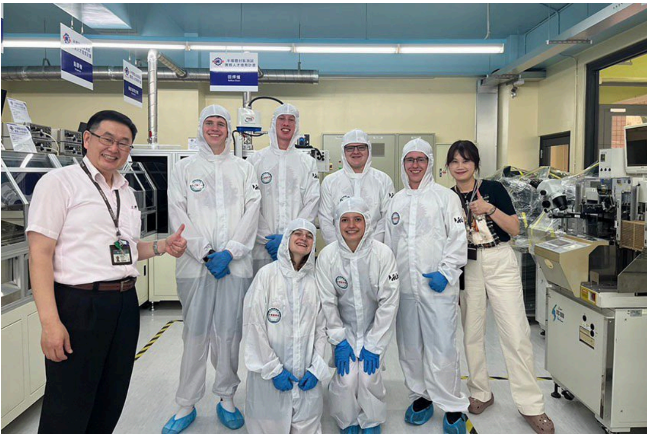
美國猶他州高中生華語研習團在明新科大進行兩週的華語學習，校方安排參訪校內半導體人才培育基地，同時學習產業關鍵字的華語，及穿無塵衣體驗半導體廠房生態。