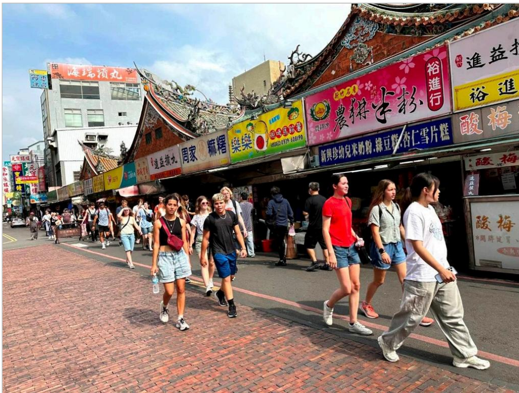
《圖說》美國猶他州高中生華語團30日下午前往新竹城隍廟踩點，認識台灣的傳統文化及新竹的歷史風貌。