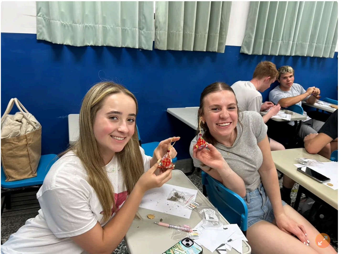
校方安排端午節的香包DIY製作。

除了課堂的學習，研習團也走訪新竹城隍廟老城區，認識台灣的傳統文化和生活方式及新竹的歷史風貌。在城隍廟，學員們對台灣的宗教信仰和民俗文化感到好奇。過程中，學員們運用課堂上學習的華語與當地民眾交流，購物、品嚐新竹的米粉、貢丸湯、芒果冰等廟口美食，接著前往巨城、後站夜市逛街當「一日新竹人」。