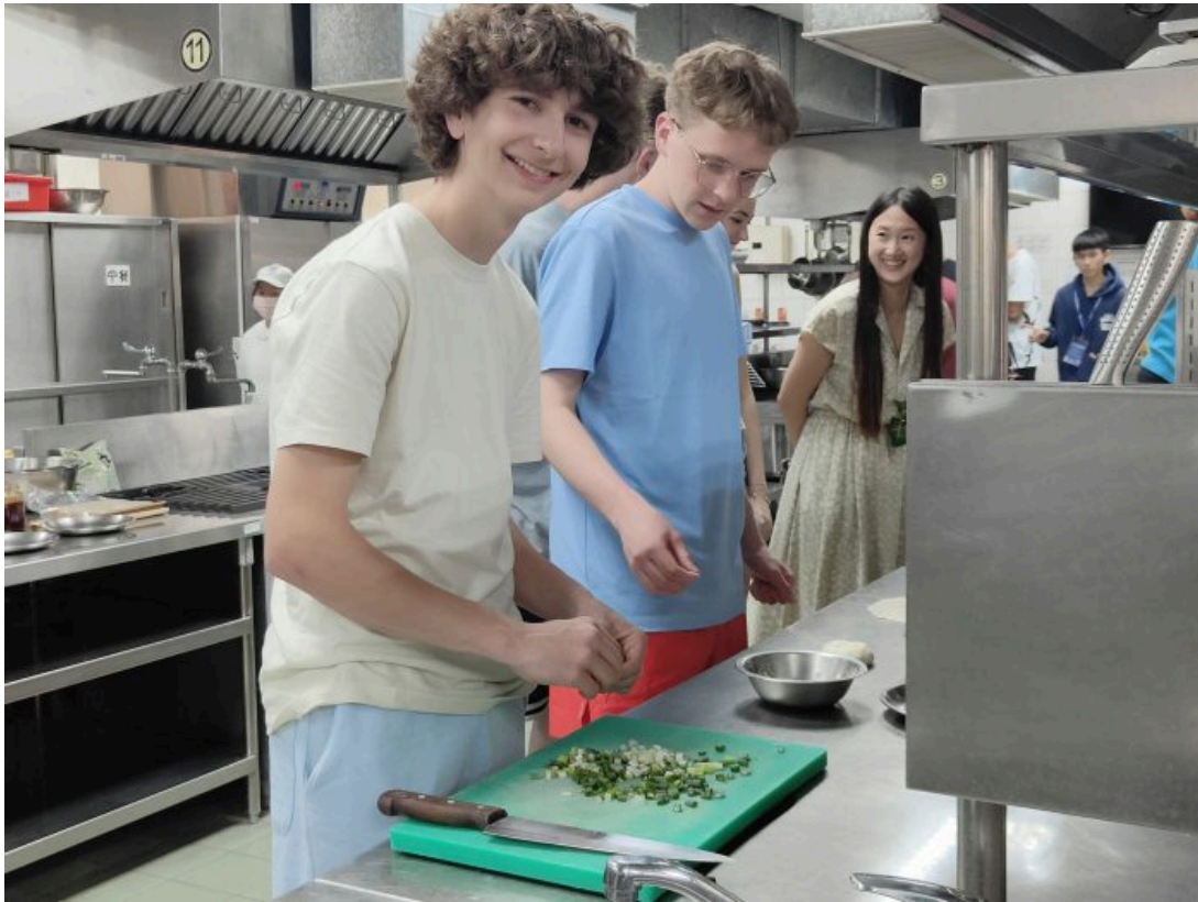
美國猶他州高中生華語研習團在明新科大體驗蔥油餅的製作。