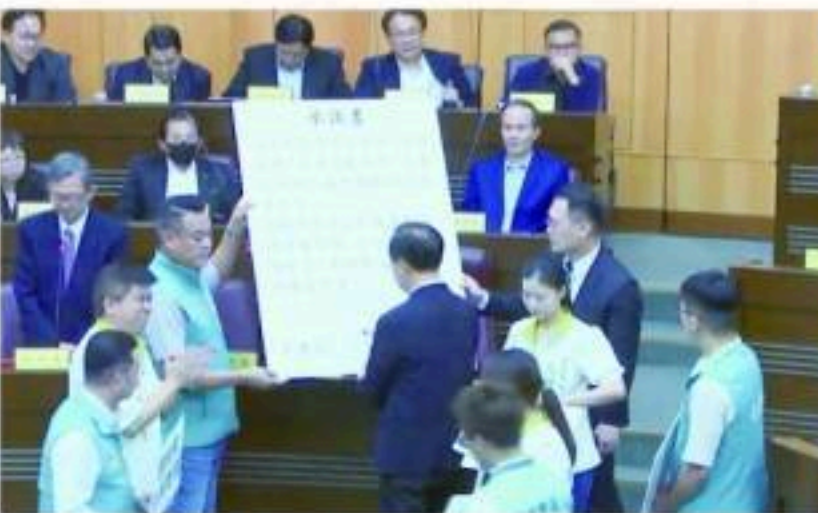
民進黨桃園市議會黨團於市政總質詢時，向桃園市長張善政遞交「支持藐視議會法案」承諾書，張善政要求補上「不違反現有法令」及「尊重議會決議」，並順利完成簽署。

議員張華其呼籲國民黨不要再雙標，立法院都三讀通過擴權法案了，請市議會國民黨團也要支持議會改革，議會也要有調查權、聽證權，讓議員的服務功能擴大。