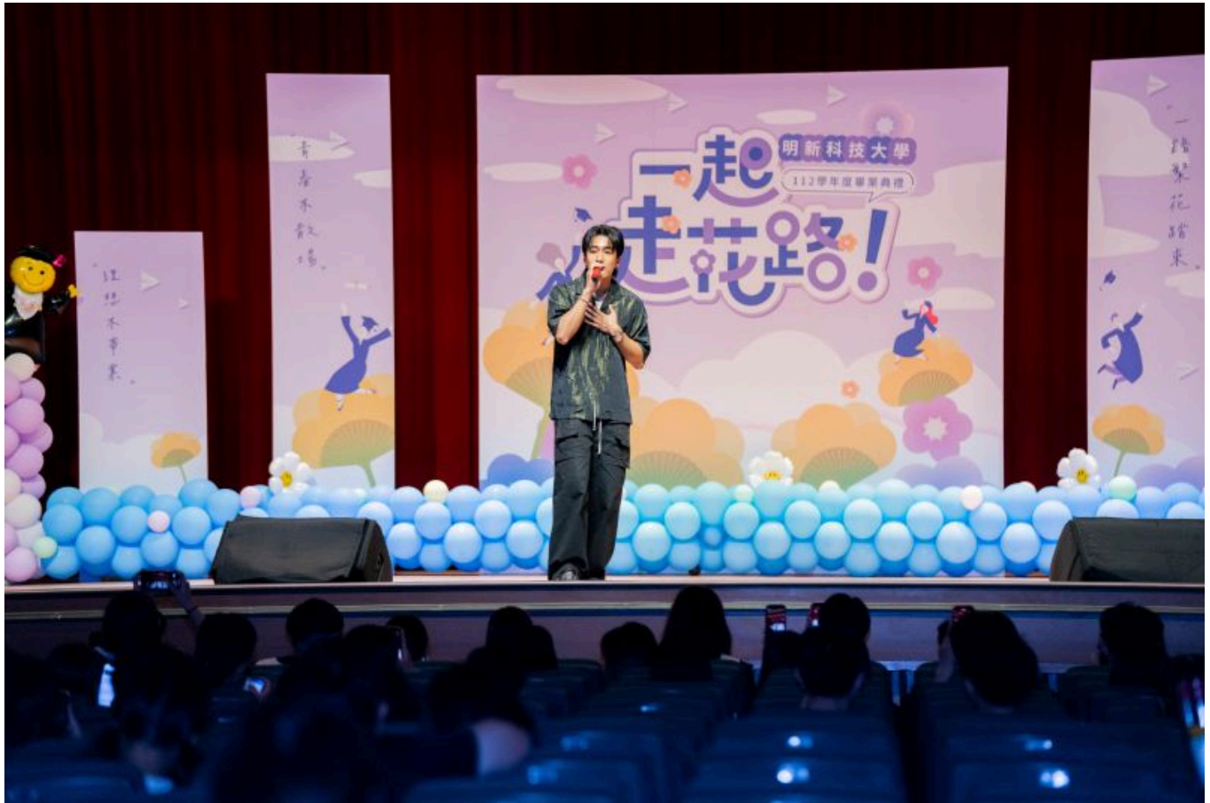
廣受年輕人歡迎的創作饒舌歌手婁峻碩，在畢業典禮最後現身演唱一起歡送畢業生

像是開起演唱會，讓出席的畢業生們在畢業典禮的歡樂氣氛中，為大學生活留下最美好的回憶。