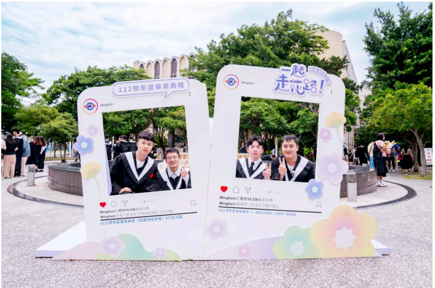
▲明新科大112學年度畢業典禮，畢業生在「一起·走花路」的打卡牆留下校園最後的美好回憶。

明新科大劉國偉校長以中英雙聲道致詞，歡迎所有國內外來參加的畢業生家長親友團。他提到做為科技人才培育搖籃，明新培養在產業有即戰力、對AI有敏銳力，以及具備國際溝通力的技職菁英，畢業生表現優異，廣受企業喜愛。劉校長希望畢業生珍惜大學同窗的緣份，帶著師長的祝福，保有熱情，持續走在花路上綻放自我，順利走向未來康莊大道。