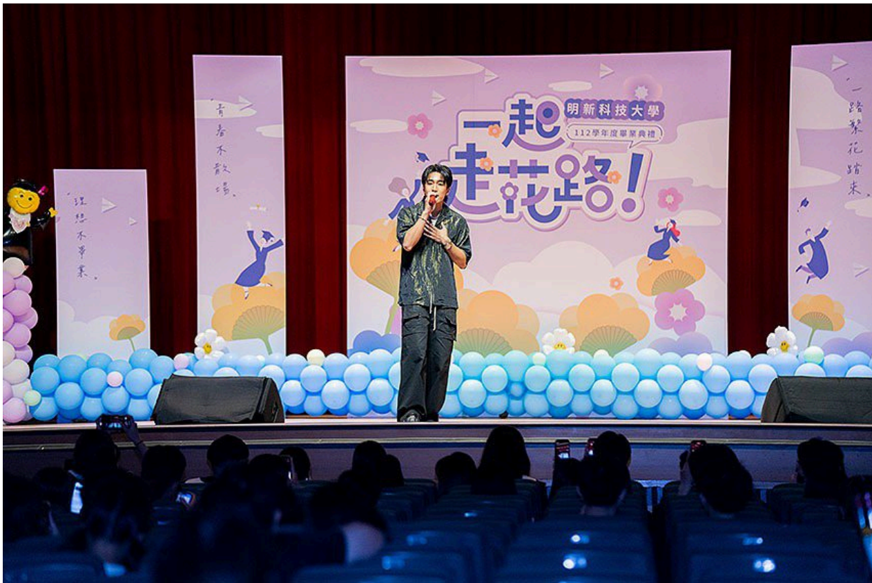
明新科大今(15)日上午舉行112學年度畢業典禮，廣受年輕人歡迎的創作饒舌歌手婁峻碩，在畢業典禮最後現身演唱一起歡送畢業生。