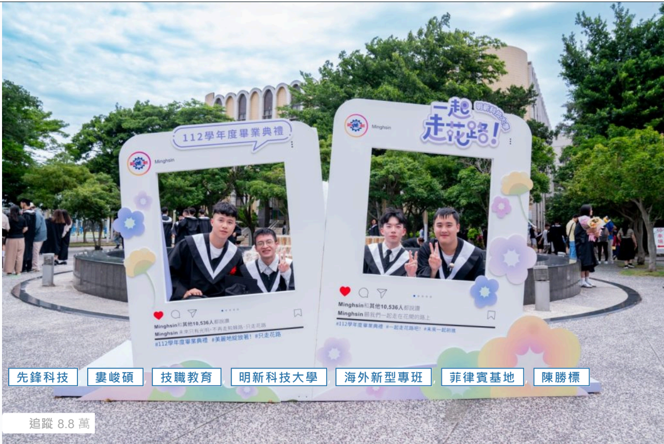
明新科大畢業生在「一起走花路」的打卡牆留下校園最後的美好回憶。