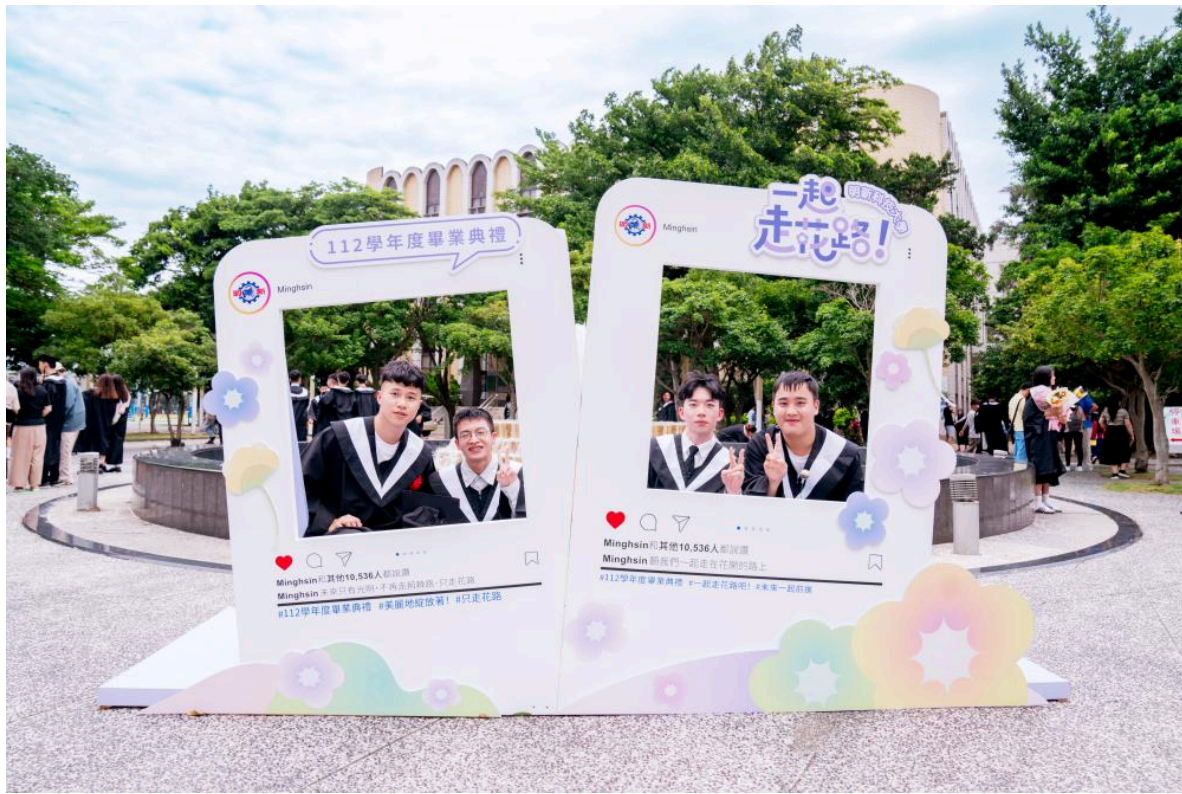
▲明新科大112學年度畢業典禮，畢業生在「一起走花路」的打卡牆留下校園最後的美好回憶。

明新科大劉國偉校長以中英雙聲道致詞，歡迎所有國內外來參加的畢業生家長親友團。他提到做為科技人才培育搖籃，明新培養在產業有即戰力、對AI有敏銳力，以及具備國際溝通力的技職菁英，畢業生表現優異，廣受企業喜愛。劉校長希望畢業生珍惜大學同窗的緣份，帶著師長的祝福，保有熱情，持續走在花路上綻放自我，順利走向未來康莊大道。