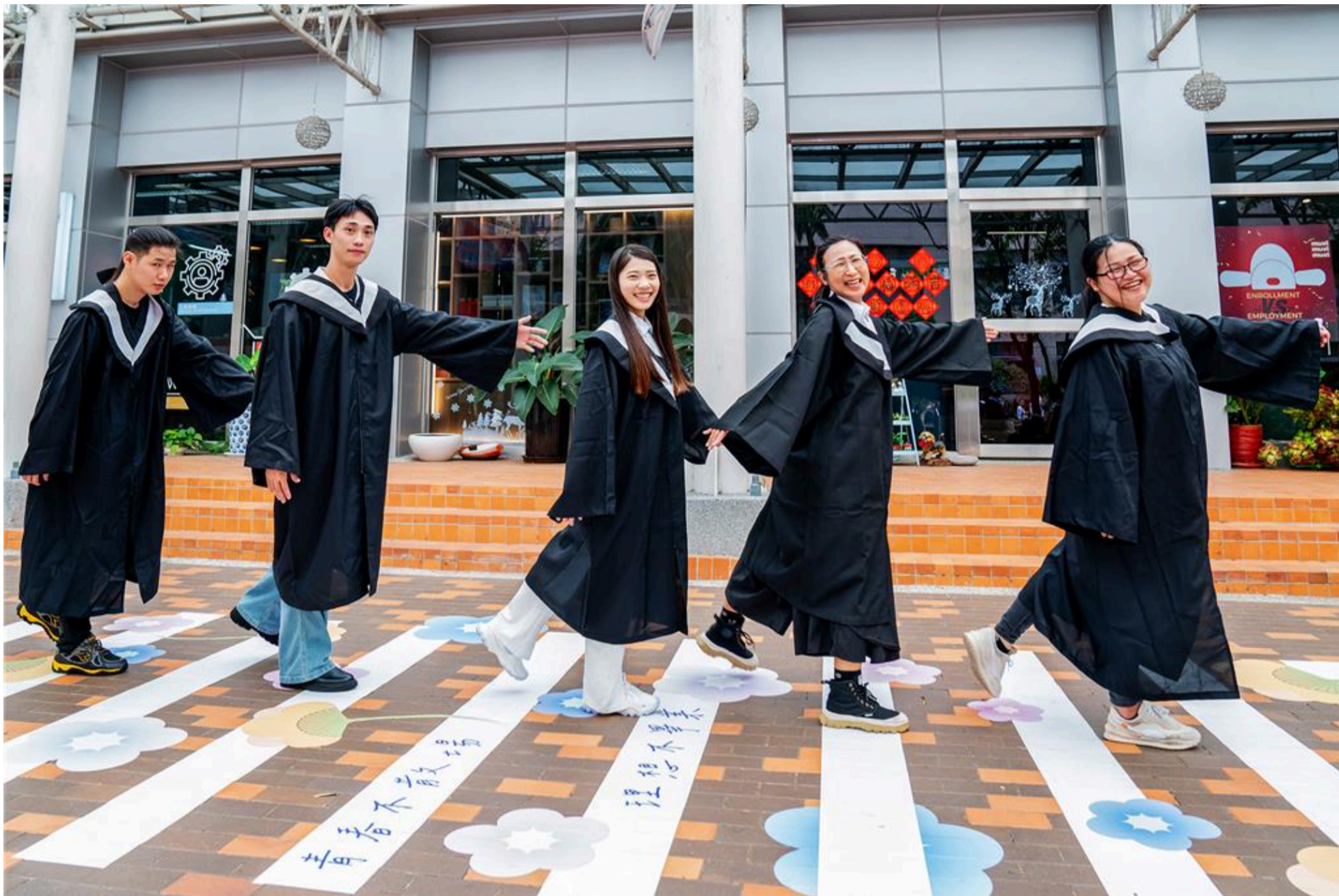
明新科大15日舉行112學年度畢業典禮，畢業生「一起走花路」，象徵走出校園後如花綻放，迎向美好未來。