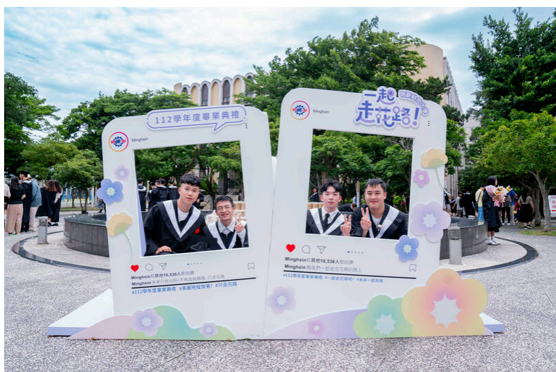
畢業生在「一起·走花路」的畢業裝置拍照。