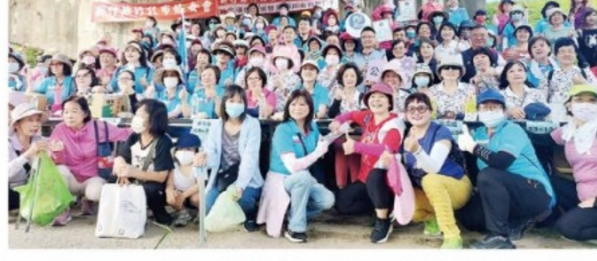
水利署第二河川分署攜手新竹縣政府、縣議會、竹北市公所、竹北市婦女會、竹北市青溪婦女協會等公私機關團體，辦理淨溪健走活動。