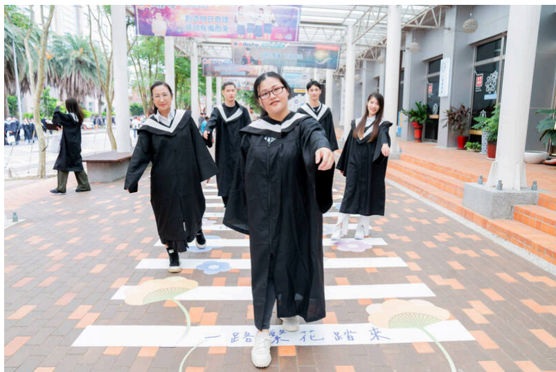
畢業生在「一起·走花路」的畢業裝置拍照。

畢委會以流行文化用語「一起·走花路」為主題，象徵「一路繁花踏來·夢想一路生花」祝福畢業生踏入社會能如花綻放，迎向美好燦爛人生。