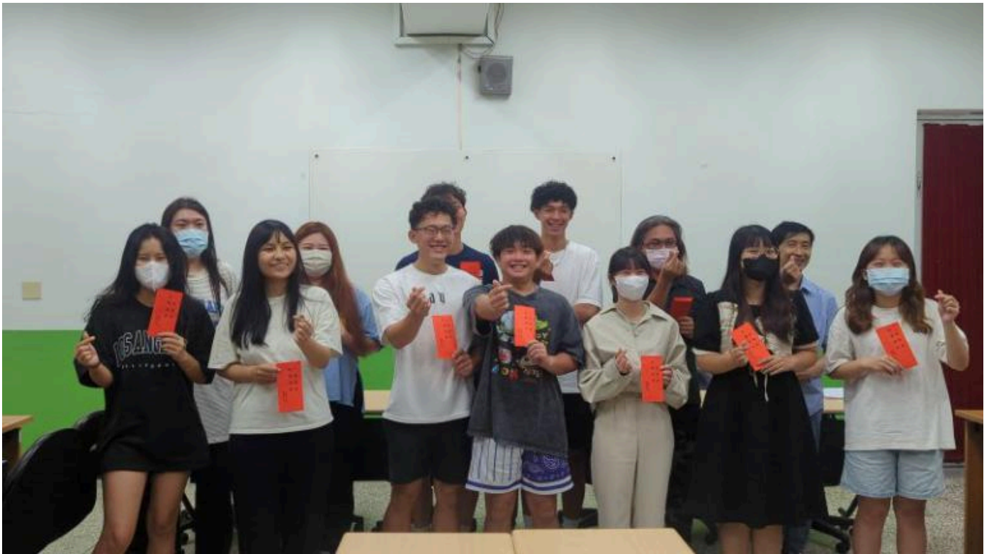
▲明新科大學生赴日交流出發前收到董事長加碼致贈零用金。