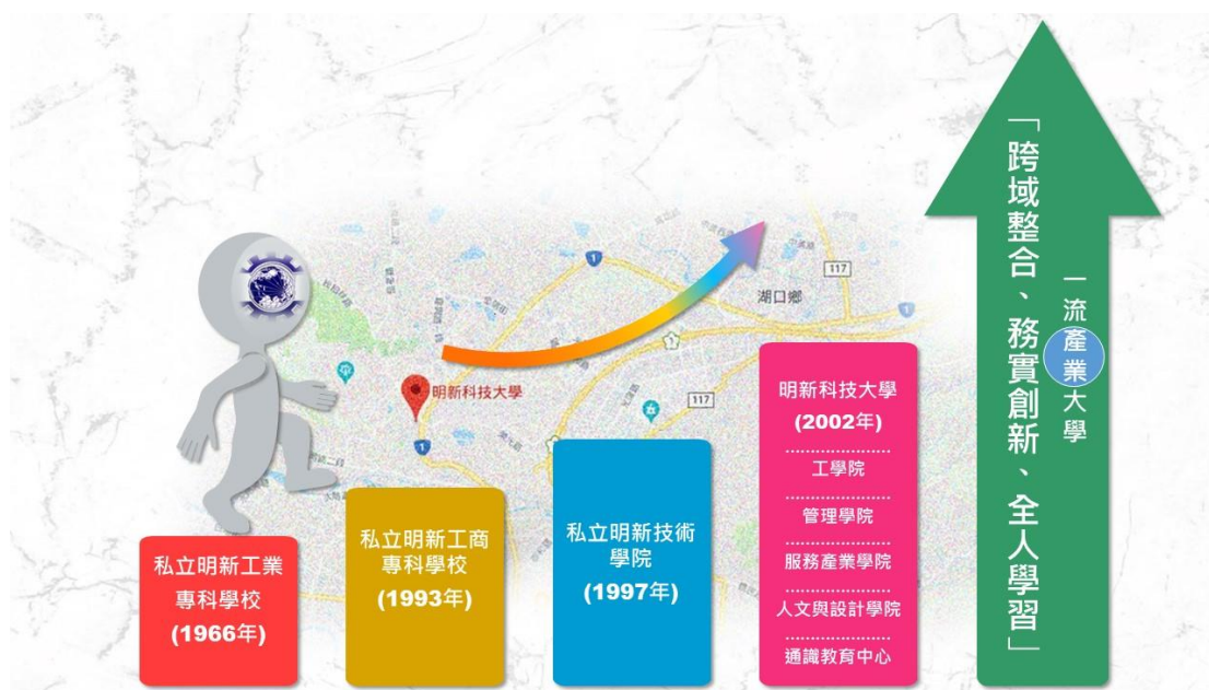
圖 1-2 明新科技大學創校沿革

有鑑於教育乃百年樹人之志業，大學教育不能忽略高尚品德的涵養，本校於 96 年 8 月增設人文社會與科學學院，並於 101 年 2 月更名為人文社會學院。於 106 年 8 月將服務事業學院改名為服務產業學院，於 108 年 8 月將人文社會學院改名為人文與設計學院，並導入設計相關專業的培養，以因應科技發展趨勢。又為校務永續發展及配合產業發展及國家施政方向，於 108 年更名為「明新學校財團法人明新科技大學」，展現全新的發展格局，邁向培育「跨域整合、務實創新與全人學習」專業人才之產業大學。