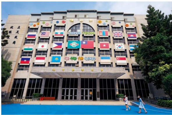
■走在明新科大校園裡，不同角落都有各國國旗和對應的語言，師生營造溫馨如家的氛圍，是他們培養國際學生認同台灣的小祕方。